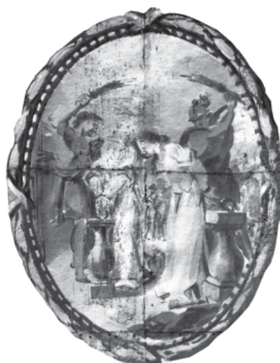
9. Escena de tortura