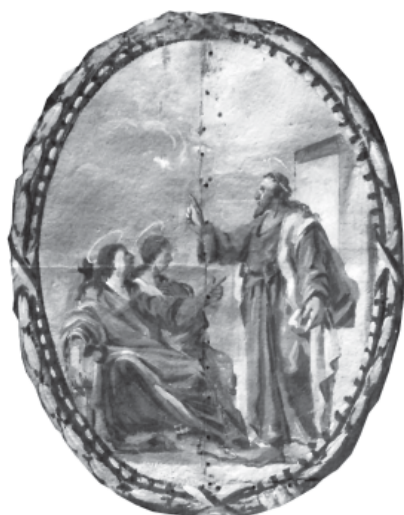
2. Sant Cugat adoctrina les Santes