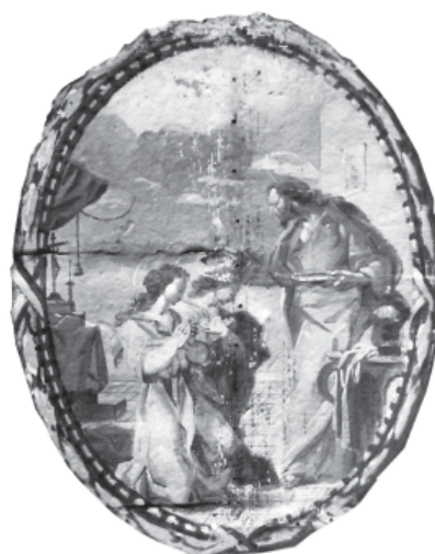
3. Sant Cugat bateja les Santes