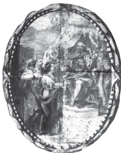
7. Davant del tribunal