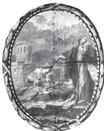
5. Les Santes sepulden sant Cugat

[6. Les Santes són preses] Tal es de su alma el incendio que hachas y planchas de fuego no las quitan el sosiego.