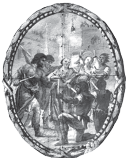
6. Les Santes són preses