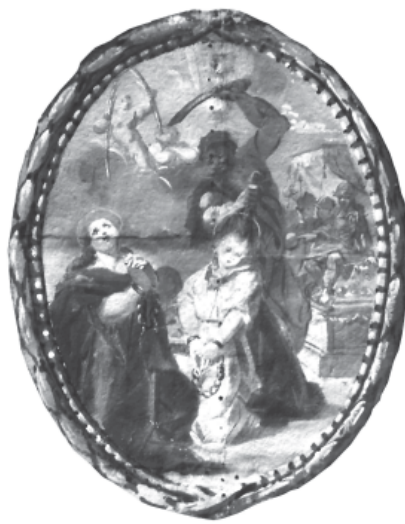
10. Degollació de les Santes

niana, considerades filles d'Iluro, l'antecessora de la ciutat de Mataró, fou confiada la seva custòdia i culte a la confraria de Sant Desideri, que les guardà junt amb les del sant fins que, l'any 1783, foren col·locades en el petit cambril projectat per l'escultor Salvador Gurri al centre del retaule de l'altar major. 3