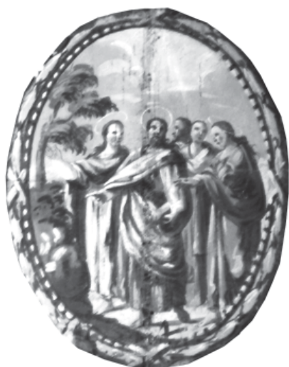
1. Trobada de les Santes amb sant Cugat