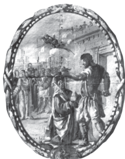
4. Degollació de sant Cugat