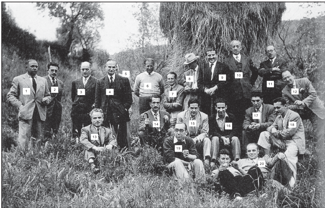
Els antics redactors i col·laboradors del Diari de Mataró i del Pensament Marià que després de la Guerra Civil restaren a Mataró, participaren en el periòdic Mataró , en l'única època que no va estar vinculat a les organitzacions del «Régimen». La fotografia els inclou amb altres redactors i col·laboradors del periòdic Mataró , en una sortida festiva, l'any 1948.