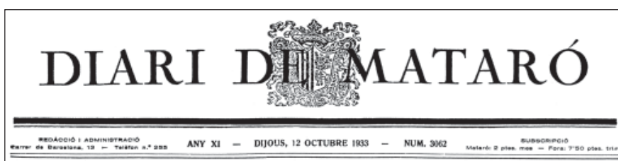
Capçalera del Diari de Mataró .

Redacció: Argentona, 24 –el carrer es deia aleshores Carles Padrós– i després carrer de Barcelona 13, seu de la Impremta Minerva.