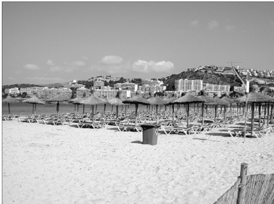
Figura 2. Playa de Santa Ponça (Calviá, Mallorca) galardonada a lo largo de los últimos años con la Bandera Azul.

obras de mejora, o bien que se efectuase una regeneración artificial.