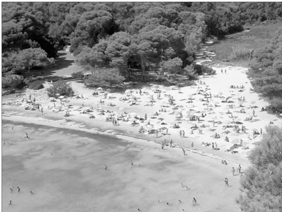
Figura 4: Playa de Macarella y Macarelleta (Ciudadella, Menorca), situada en un Espacio Natural Protegido.

cas geoambientales de los sistemas litorales, así como medidas de esponjamiento de los espacios urbanos más inmediatos pueden resultar unas medidas más rentables para el espacio gestionado, tanto en conservación como en promoción turística.