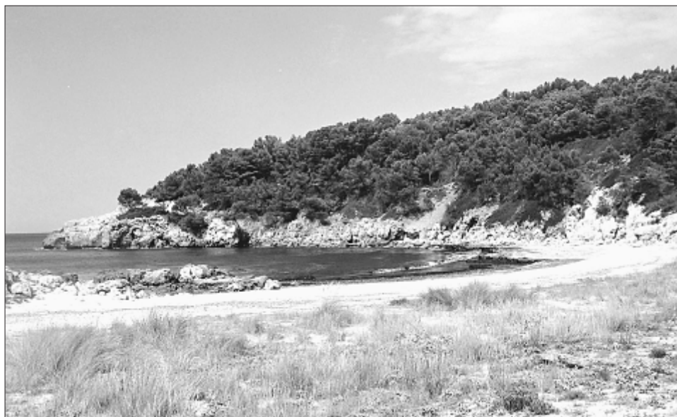
Figura 3: Playa Cala Escorxada (Es Migjorn Gran, Menorca), situada en un Espacio Natural Protegido.

ISO, EMAS y la Q, que –sin suponer necesariamente actuaciones rígidas– conciben el litoral como un espacio donde ubicar servicios. Por el otro, están las perspectivas