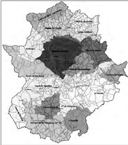
Fig. 1. Unidades físicoambientales.

exclusiva: Directrices de Ordenación Territorial, de aprobación por el Parlamento; los Planes Territoriales y los Proyectos de Interés Regional, de aprobación por el Consejo de Gobierno.