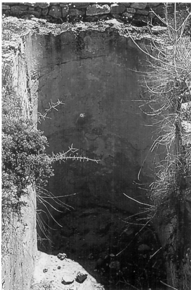
Les pallisses de Cala d'Hort. Detall d'un angle de la cisterna.

desapareixent del nostre entorn i que constitueix els llocs on han quedat les petjades de les activitats dels homes i les dones a través del temps.