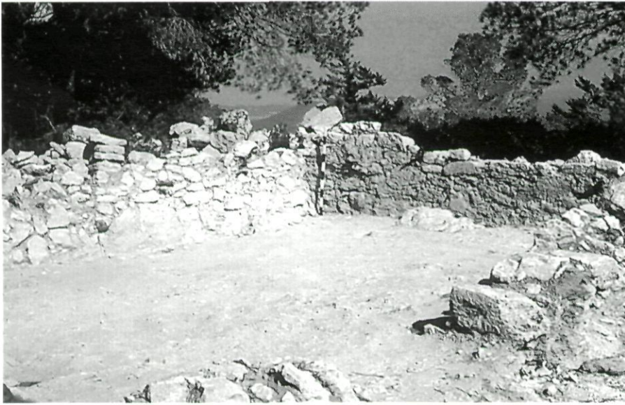
Establiment de can Corda (es Cubells). Habitació que conserva un tros de paret referida.

que va conèixer, almenys fins al canvi d'era, un tipus d'explotació extensiva, organitzada a través de finques de gran superfície d'una jerarquització i un intercanvi entre elles, mentre que a la zona del pla des Jondal podria presumir-se una extensió teòrica d'unes 20 o 25 ha per cada hàbitat (Ramon, 1984:32) i pensar en uns termes diferents de producció.