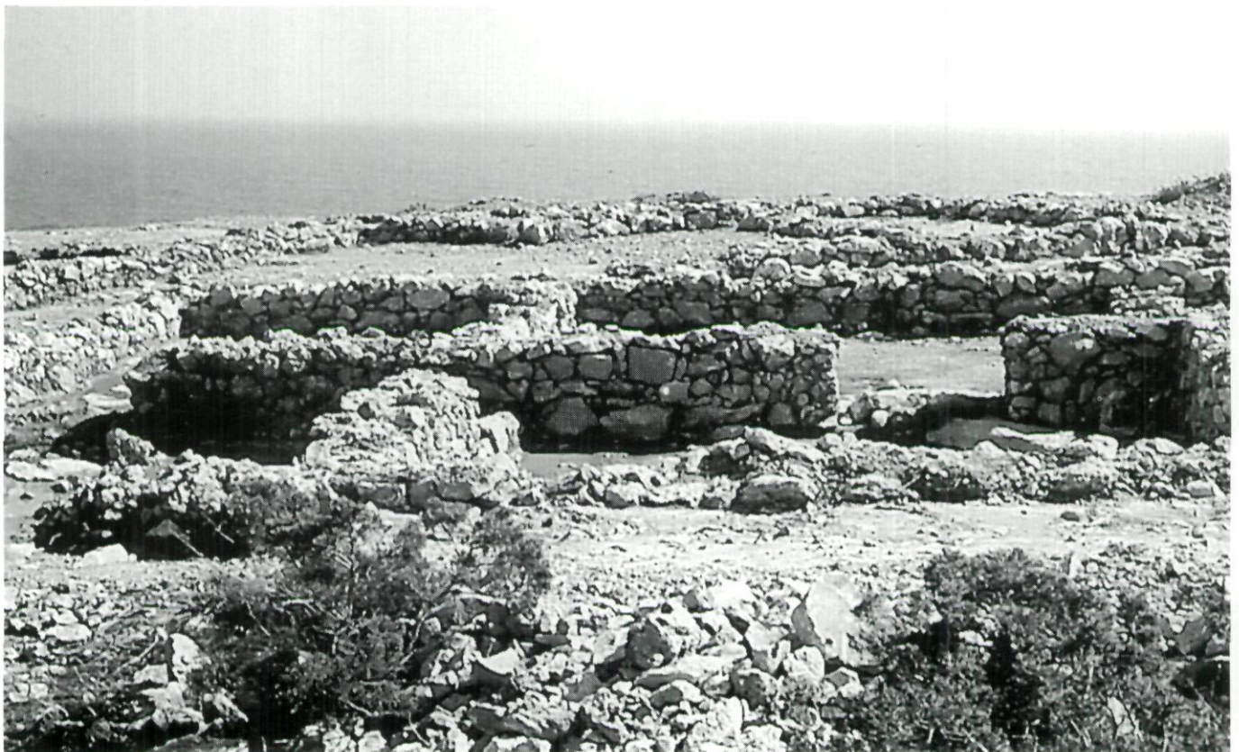
Assentament fenici de sa Caleta. Detall d'algunes estances.