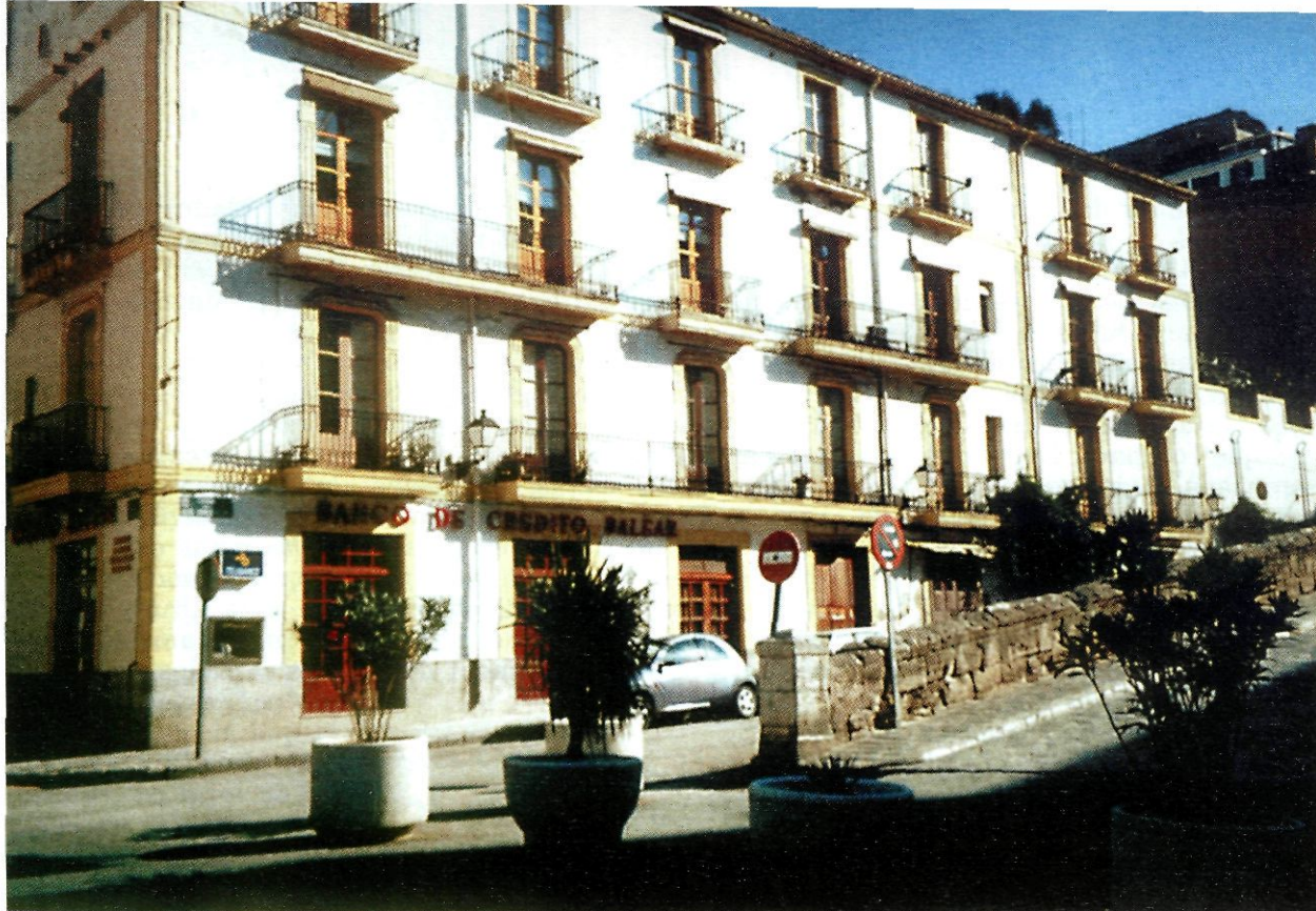
Casa natal de Joan Gamis- sans.

pueblo natal, me creería obligado, de no sentirme vivamente impulsado, como es así, a prestar a la obra todo mi saber y mi mejor voluntad a fuer de artista y de ibicenco. Sería realmente criminal privar a Ibiza, por pecado de inercia y apatía, de una entidad cultural que tanto puede contribuir a su renombre y a su desenvolvimiento artístico.