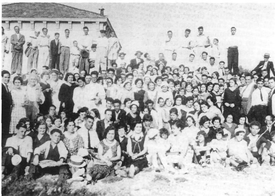
L'Orfeó Eivissenc a Sant Antoni devers 1931-32.