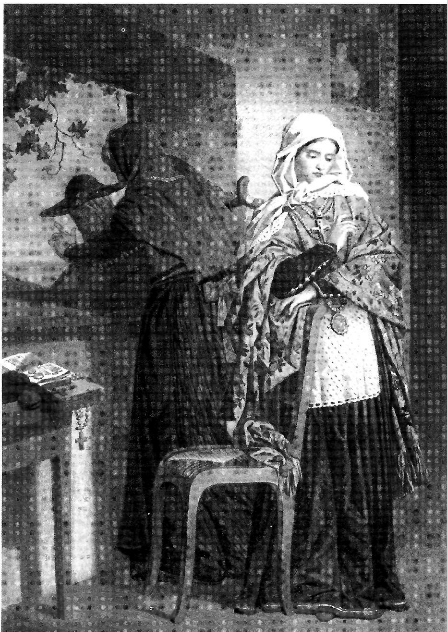
Vestits populars de les dones pitiüses. — L'arxiduc vol donar a conèixer en aquesta làmina la diferència en la indumentària eivissenca d'una jove i d'una vella. Banda fora de la finestra presenta la imatge d'una dona formenterera que als voltants de Sant Francesc l'«acolli amablement sota un sostre hospitalari». En destaca el pesat capell de feltre negre amb ala fixa a la part central mitjançant cintes de colorins i adornada amb una cinta vermella amb una borla petitiua, però, ja passat de moda els anys vuitanta, les dones es tocaven amb capell de palla o amb un mocador.

emigrats era Alger (colònia francesa), les Antilles espanyoles (sobretot Cuba) i la resta d'Amèrica, principalment, encara que alguns formenterers també feien la seua estada fora de l'illa embarcats, tant en vaixells nacionals com estrangers. Podem llegir al volum segon de Les antigues Pitiüses la lamentació per no poder oferir xifres concretes d'emigració per manca d'estadístiques oficials, tot i assenyalant que el