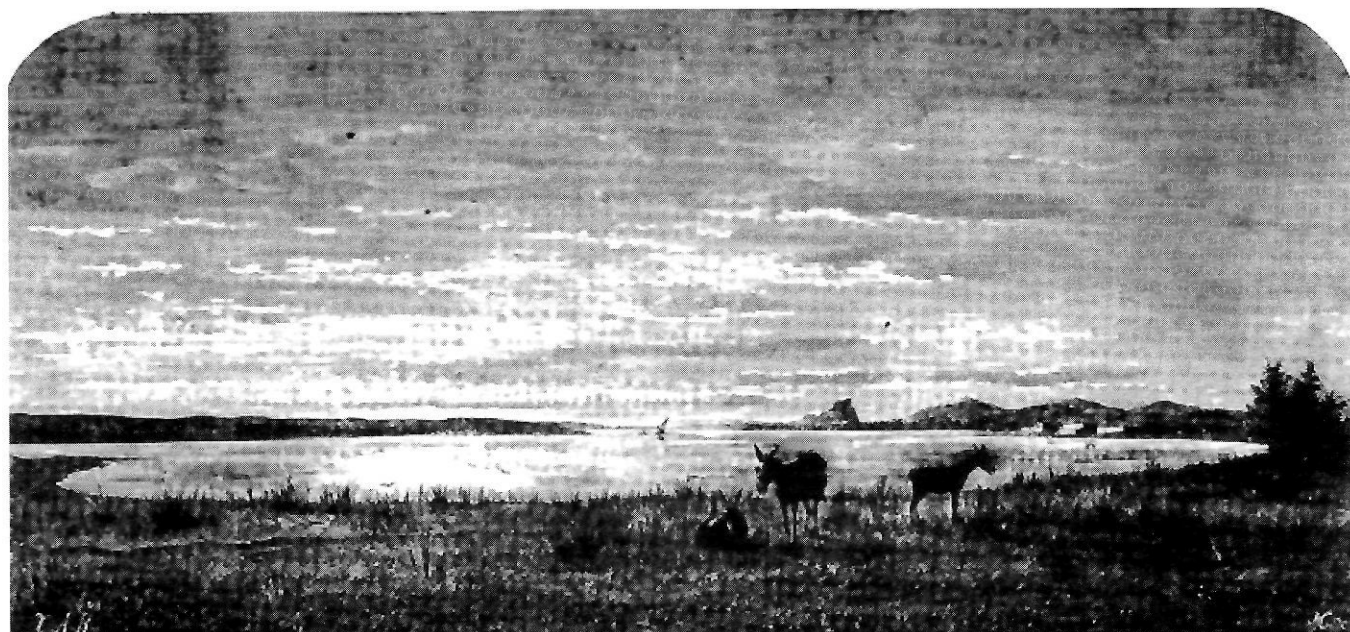
Estany des Peix. - La sensació de solitud en un espai fora del temps es mostra en aquesta xilografia amb el falutx embarrancat i les construccions enrunades vora una superfície brillant com un mirall. Només els tres animals posen una nota de pausat moviment entre una vegetació de joncs i algunes savines. Al fons, l'estreta gola que comunica amb la mar i, just a tocar, el Vedrà i els puigs de la costa sud-occidental d'Eivissa.

La pesca, abundant en aigües de Formentera, és ja important per als homes de l'illa que la practiquen com a complement dels cursos familiars i també com a professió: parla d'una trentena de