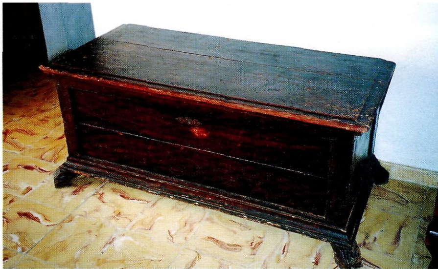
Caixa, i almud i quarteró.