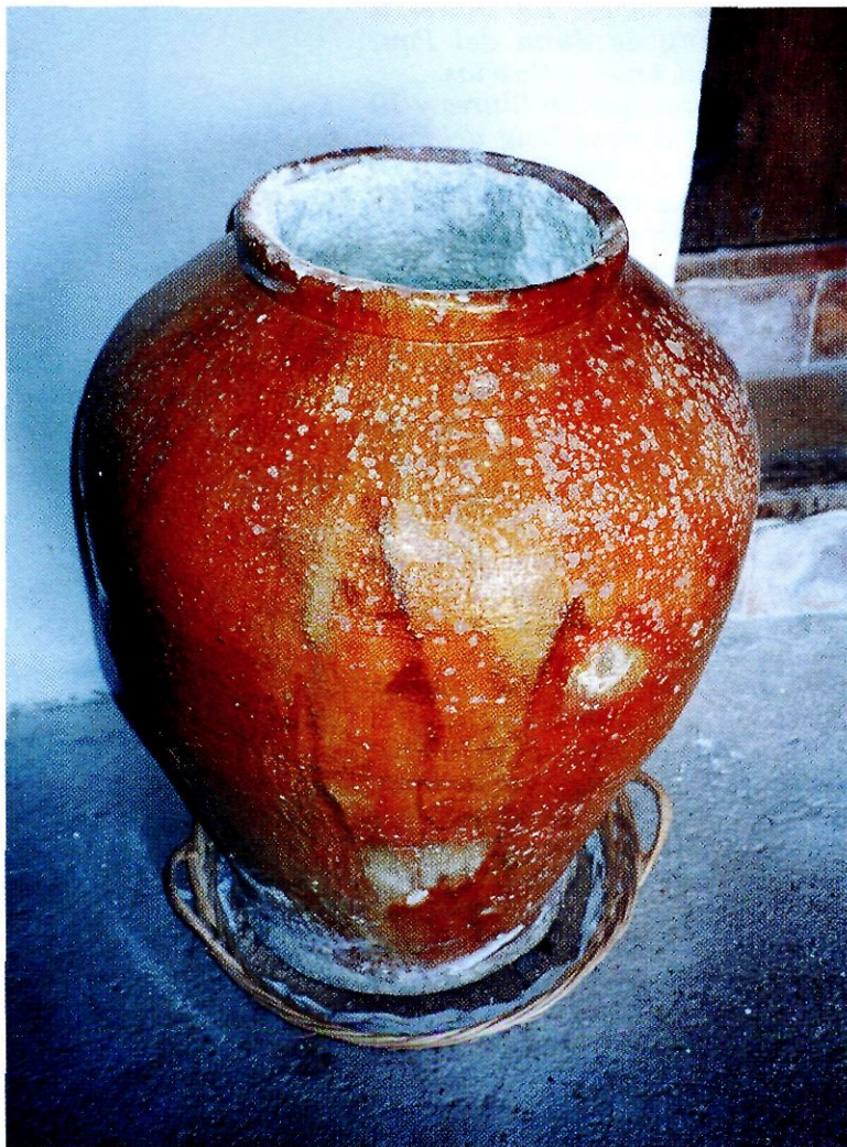
Una alfàbia de calç.

Tres camias de home y un llansol de lli, per 65 lliures, a