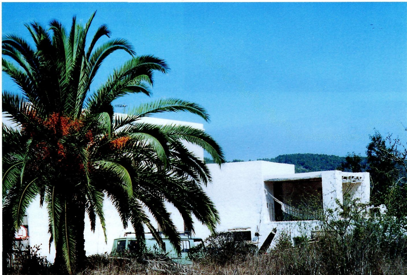
Can Figueretes, a la vénda de Safragell, de la parròquia de Sant Llorenç de Balàfia.

L'any 1647 ja consta documentalment que existia la família Cardona "Figueretes", a Balàfia, nom que aleshores comprenia de forma general tot el terme que posteriorment (1785) va constituir la parròquia de Sant Llorenç.