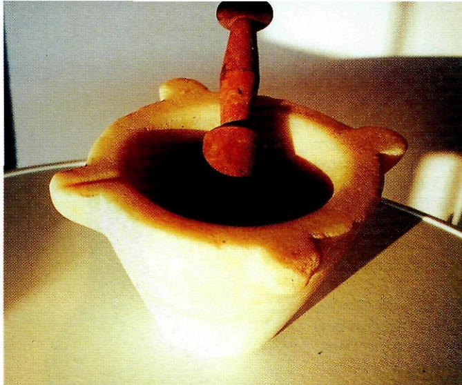
Morter de pedra.