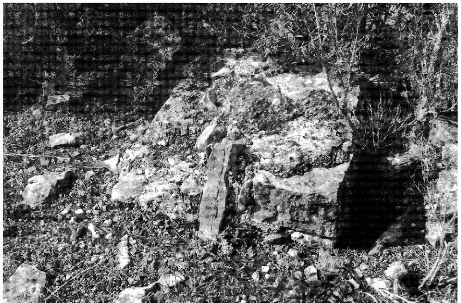
Fita del cim del puig de l'Argentera (XIII).

La casa i el nucli principal de les terres que des del segle XVI es coneixien com la torre de l'Alzina ara són can Xumeu de l'Alzina. De la gran extensió de terres que tengué la hisenda se n'anaren separant algunes porcions on es feren noves cases que recorden l'Alzina. L'edifici de can Xumeu de l'Alzina es reformà i s'amplià molt a la primera meitat del segle actual. Fa anys que el propietari, mentre mostrava la circumferència de la base de la vella torre que encara es pot veure perfectament, recordava que quan la desferen per construir amb la seua pedra la part alta de la casa, trobaren algunes armes de foc molt antigues amagades dins els murs.