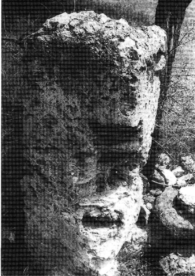
Fita de la torre de l'Alzina (XI).