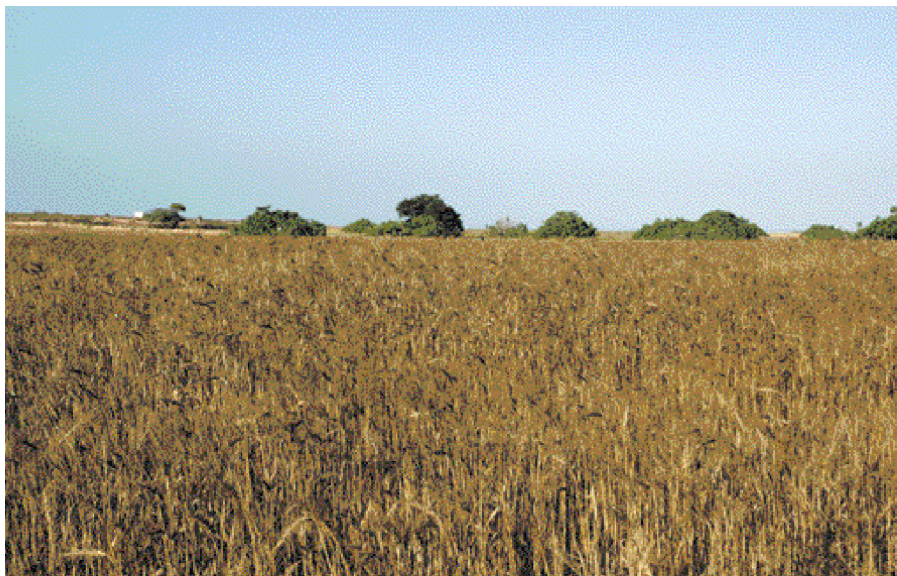
Cereal a punt de segar a la Mola, Formentera. Guillem de Montgrí acusà Arnau Renard de no haver-li pagat els fruits de Formentera durant disset anys i d'haver deixat tornar erma l'illa en no conrear-la i amollar-hi bestiar i porcs i truges seus.

Fra Guillem Blanc no emparà sense avisar abans i cessà l'empara quan rebé carta del sagristà.