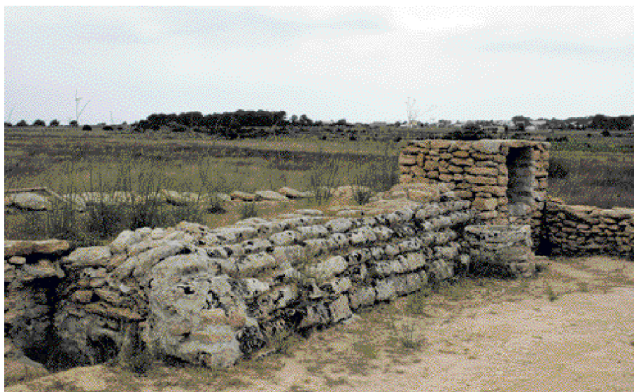
L'aljub Gran del Monestir, la Mola, Formentera, actualment dit d'en Talaies; fet de volta de carreus és tal vegada una mostra del poblament medieval de l'illa. (Foto A. Ferrer). A la pàgina anterior, mapa de Formentera de F. Coello, 1851. (Arxiu Històric d'Eivissa).