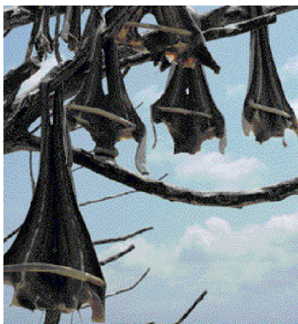
Peix posat a secar al Torrent de s'Alga. A les dures condicions de vida que es donaven a Formentera s'afegia la fiscalitat imposada pels senyors de l'illa.