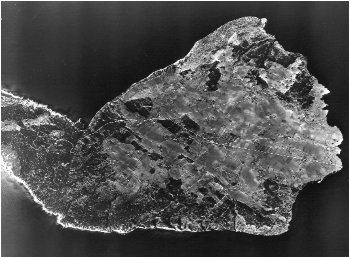
La Mola de Formentera, foto aèria feta per la força aèria nord-americana (USAF) l'any 1956.

dimecres passada la festa de Sant Nicolau (6 de desembre) a la seua casa de Girona. Les parts volgueren per assessor el jurisperit Pere de Fontclara.