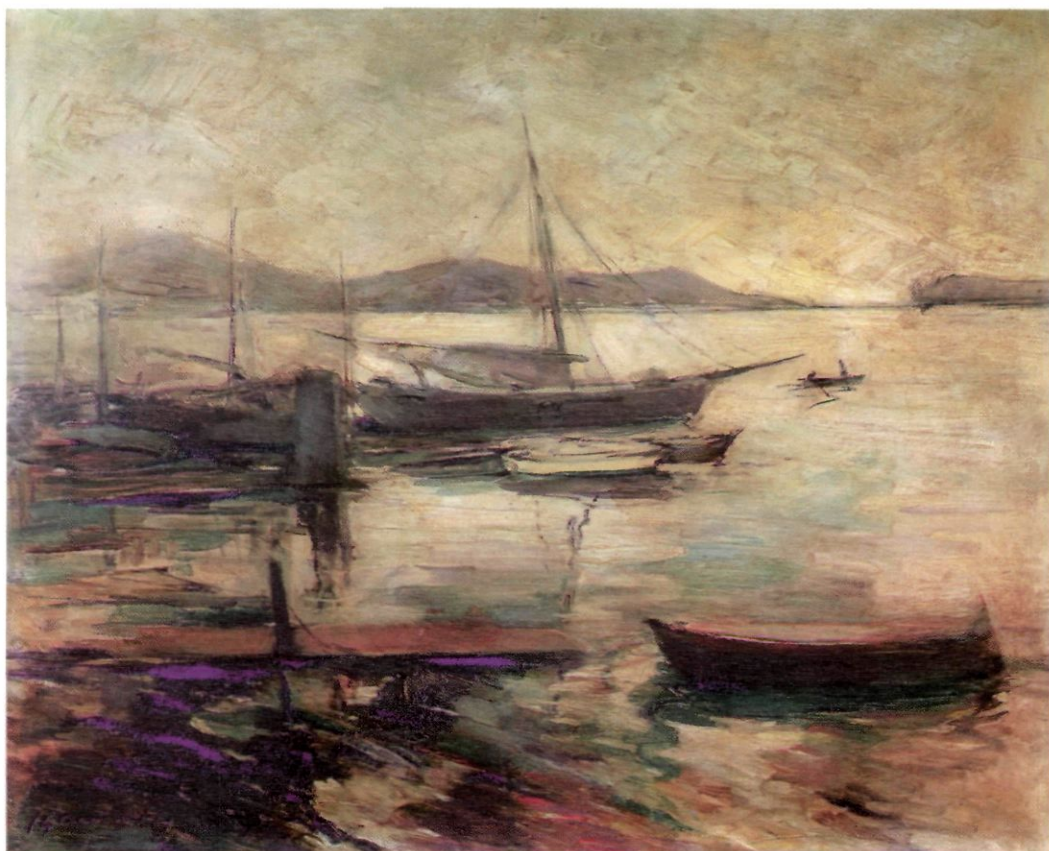
Una de les dues pintures de Gausachs que foren determinants de la decisió de l'autor d'aquest article d'anar a Sant Antoni.

estar de fer una part del viatge al seu costat, en la mesura que em fou possible. Va resultar que vivien a l'Eixample, molt a la vora de casa, al carrer Llúria, entre Mallorca i Provença. La noia em donà l'adreça. Arribats a Barcelona, com que no hi havia taxis, vaig poder llogar un carro, oferint a la noia i a la mare d'acompanyar-los, perquè ells eren quatre i amb els seus equipatges gairebé no cabien en un. La mare refusà categòricament. L'endemà em faltà temps per anar a saludar-los. Eren les deu del matí, una hora que em semblava escaient. La portera m'informà que no hi eren, que havien partit tots a primera hora del matí, no sabia on. Era comprensible: la mare temia, amb raó, que els elements que s'havien oposat a l'alliberació dels nois no arribessin amb un altre vaixell o no telegrafiessin als seus sequaços i que aquests no vinguessin a prendre's la justícia pel seu compte.