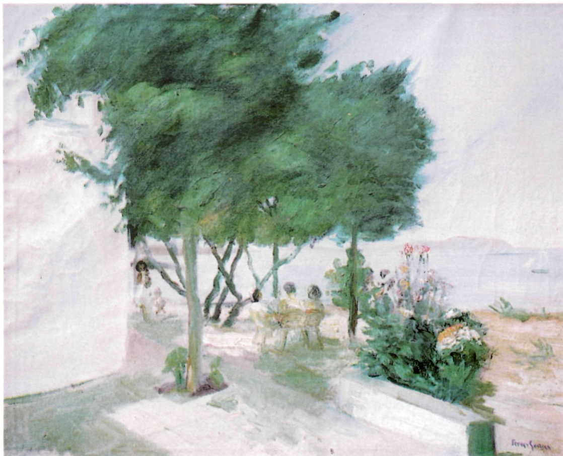
La terrassa de l'hotel "Ses Savines", en un oli de Ferrer Guasch dels anys quaranta (50 x 61 cm).

Jo havia conegut, banyant-me a "Ses Savines" o pels seus encontorns, una família de la capital, Eivissa, que tenien una barraqueta allí, vora el mar, i eren els amos d'un magatzem que es deia Ca l'Aniseta. El noi era aproximadament de la meua edat i estudiava, els hiverns, a l'Escola Industrial de Barcelona. Foren