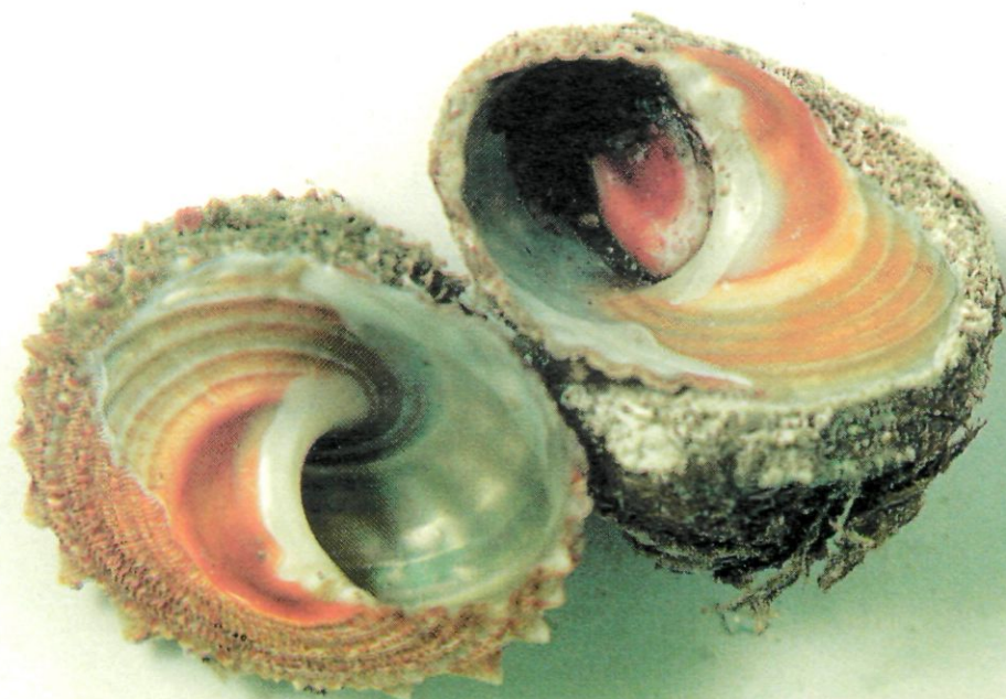
Caragols de tap. En el de la dreta, es pot veure la formació d'una pedra de compte.

i ses Bledes afavoreixen l'acumulació i l'amuntegament de pedres de compte a les costes properes. Així es començà a conèixer aquest indret amb el nom de la punta o la platja de les Pedres de Compte . I no cal fer aquí el joc de l'ou o la