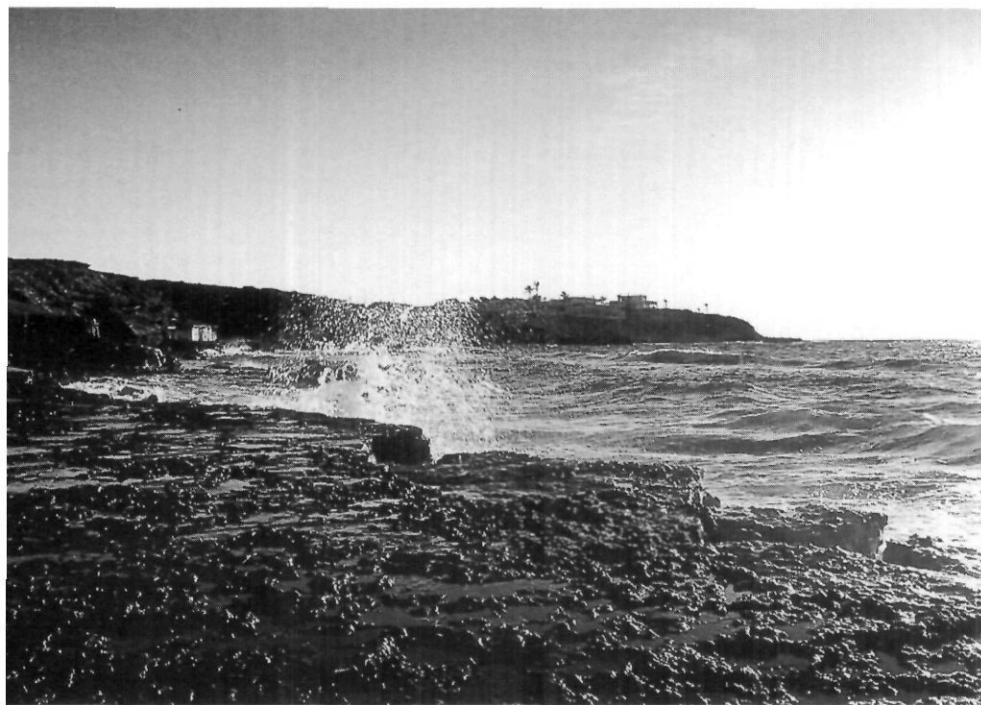
La costa oest de Comte, i s'Embarcador al fons.

ens recorden la participació de Nunó Sanç en el fet de la conquesta de 1235 i posterior repartiment de les terres d'Eivissa. Ell, recordem-ho, fou senyor de Portmany.