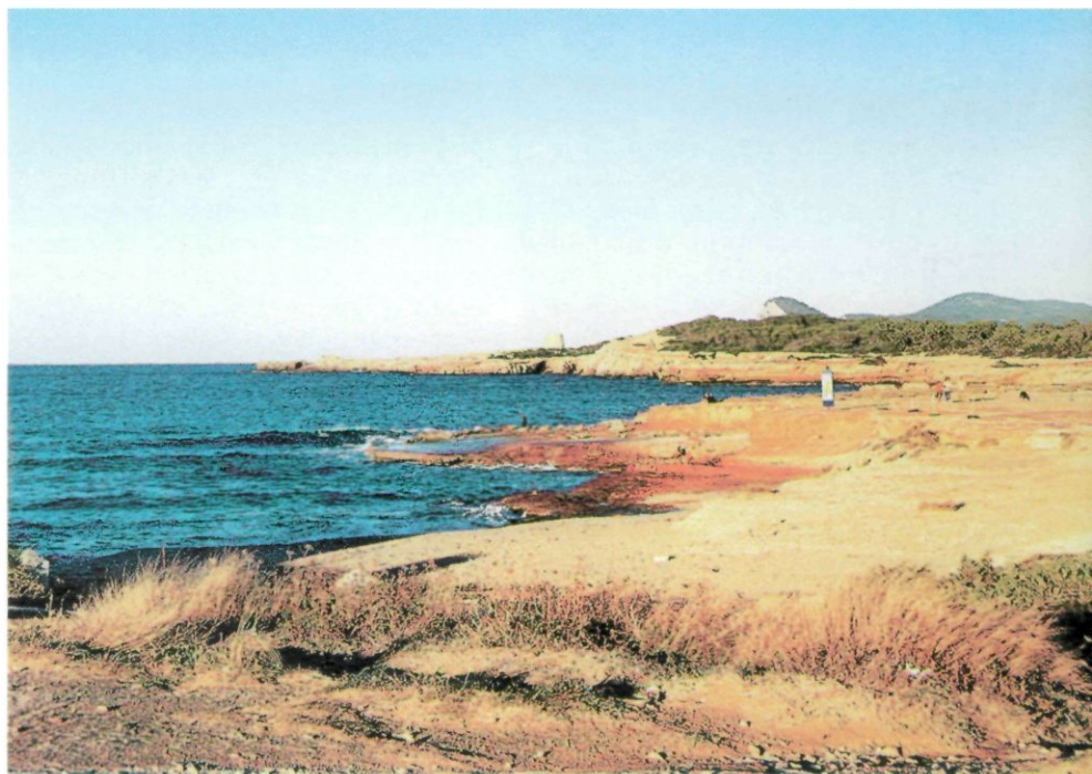
La torre de defensa costanera d'en Rovira i el cap Nunó des de Comte.

Fins fa pocs anys, la platja, avui anomenada cala Comte , havia estat sempre afortunada amb aquesta mena de copinyes (pedres), de forma esferoïdal, aplanada i, per cert, molt brillants; tant i així que resultava una distracció divertida anar-les a recollir destriant-les dels altres elements de l'arena de la platja. Malauradament, al nostre mar pitiús, aquests caragols, com altres espècies, escassegen més avui que temps enrere i tampoc no és fàcil de trobar, entre l'arena de les nostres platges, copinyes ni d'aquesta ni d'altres classes. Ara resulta més còmode esperar l'arena descarregada per les barques areneres, que remouen els fons marins i, de manera artificial, ens preparen les