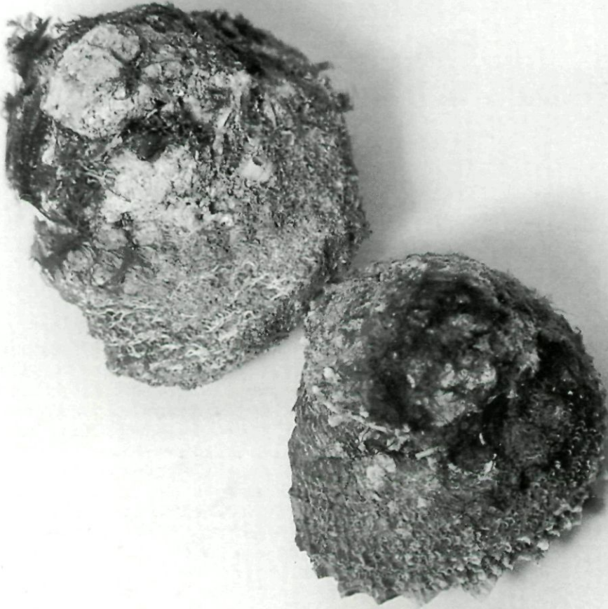
Caragols de tap.

d'Aragó (1242) i, de seguida, passaren a altres consenyors. En tan poc temps, sembla gairebé impossible que els nous colonitzadors portmanyins recordassin no sols el nom sinó també el títol nobiliari del seu primer consenyor de Portmany per nomenar-hi un indret de tan poc interès. I si no ho varen idear ells, com ho havien de plantejar els seus hereus? A les Pitiüses, per sort o desgràcia, no n'hi ha hagut mai, de títols de noblesa i, baldament el nom d'en Nunó Sanç resultàs més o menys conegut als primers colonitzadors catalans, sembla molt aventurat creure que volguessin destacar la costa de les Roques Males amb el seu títol nobiliari. Sempre, els nostres illencs s'han anat apanyant entre ells mateixos o amb les delegacions pròpies d'altres senyors o estaments superiors i llunyans, per tant poc considerables; van passar molts anys abans que algun dels consenyors feudals d'aquestes illes es dignàs a venir-les a visitar. Encara que no del tot evident, sí que és molt probable que cap dels tres