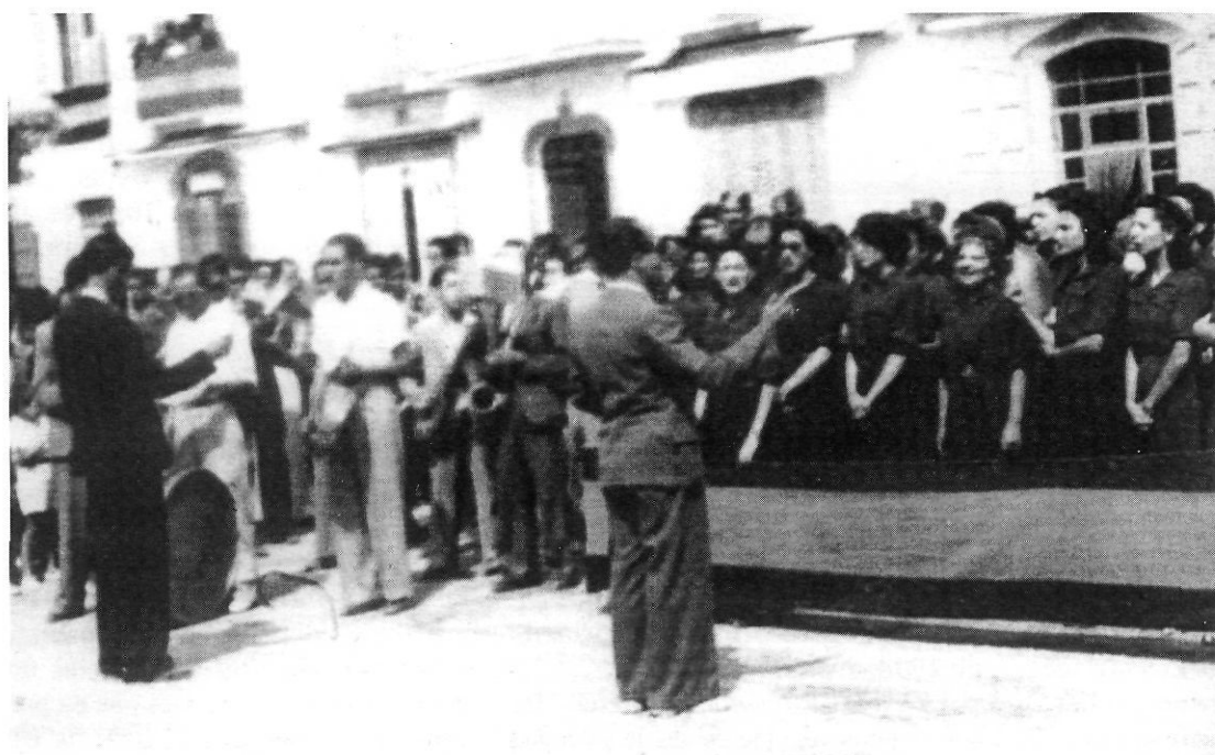
El cor d' Educación y Descanso a Vara de Rey. Any 1944.