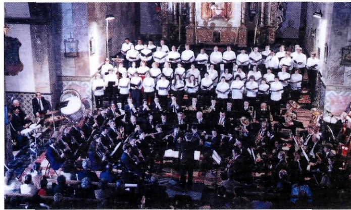
El cor i la banda Ciutat d'Eivissa al Convent el 1999.