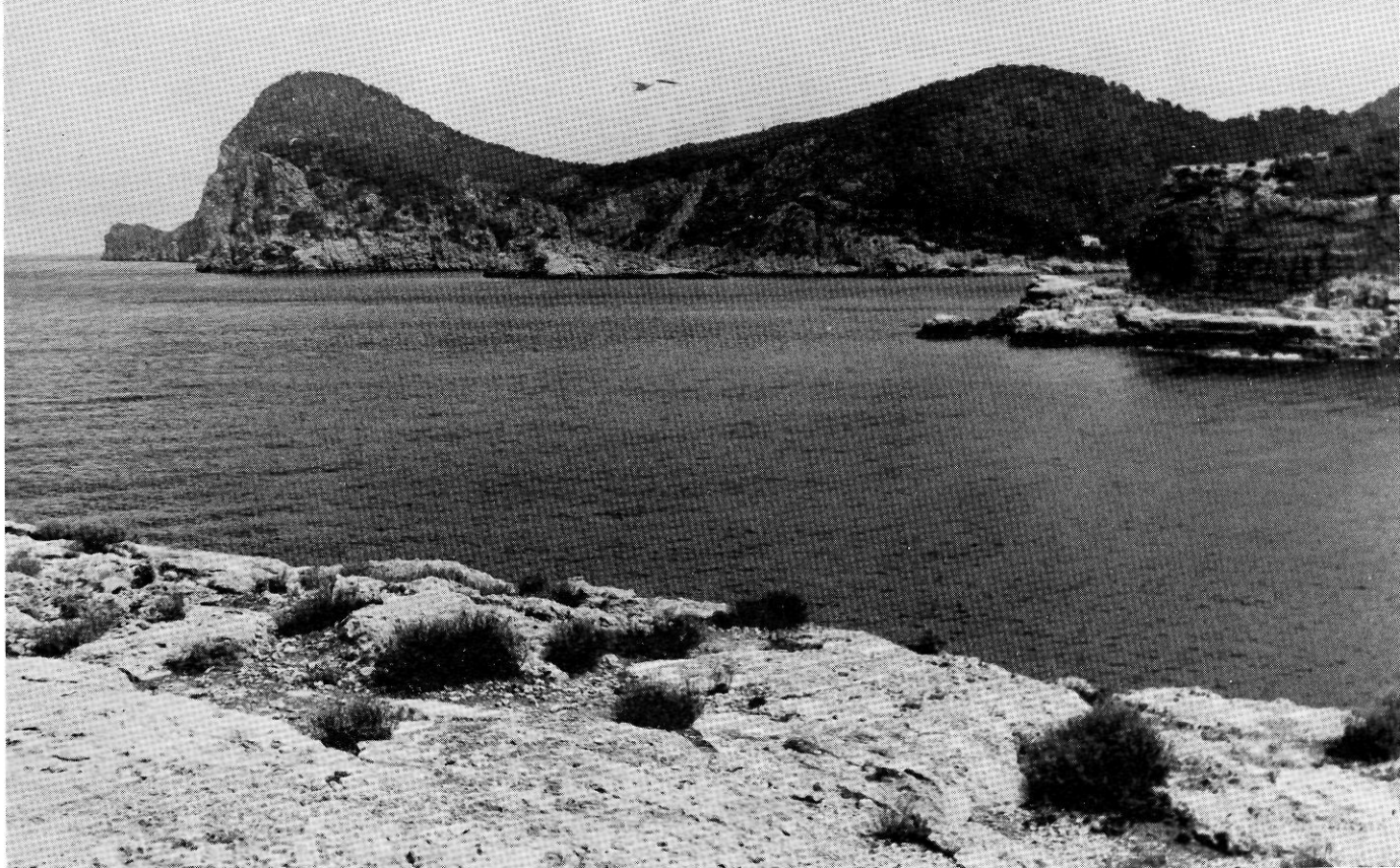
Cap Nunó. Record secular que al seu cim començaven les terres del quartó de Portmany, que fou del comte Nunó Sanç.