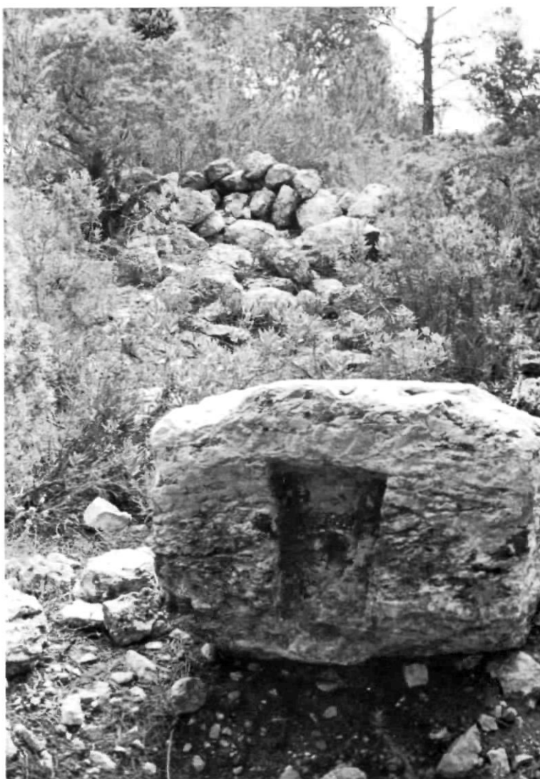
Puig d'en Corda, pesa d'un trull.