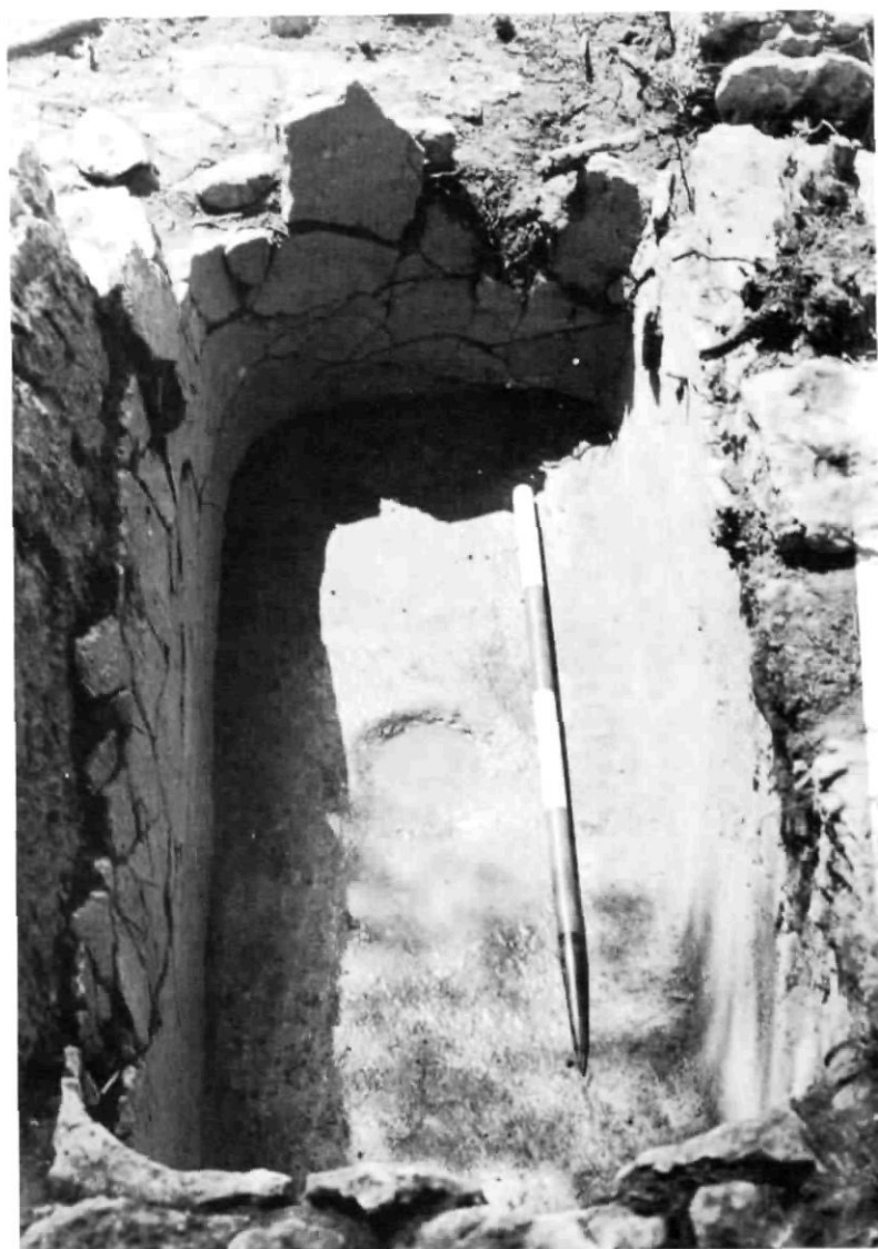
Dipòsit d'emmagatzematge d'una premsa d'oli. Jaciment de Can Corda, Sant Josep. Excavacions de 1986.

envers el camp es va veure afavorit per la inexistència d'una població indígena amb la qual hagués d'enfrontar-se o hagués d'arrabassar-li les terres 17 .