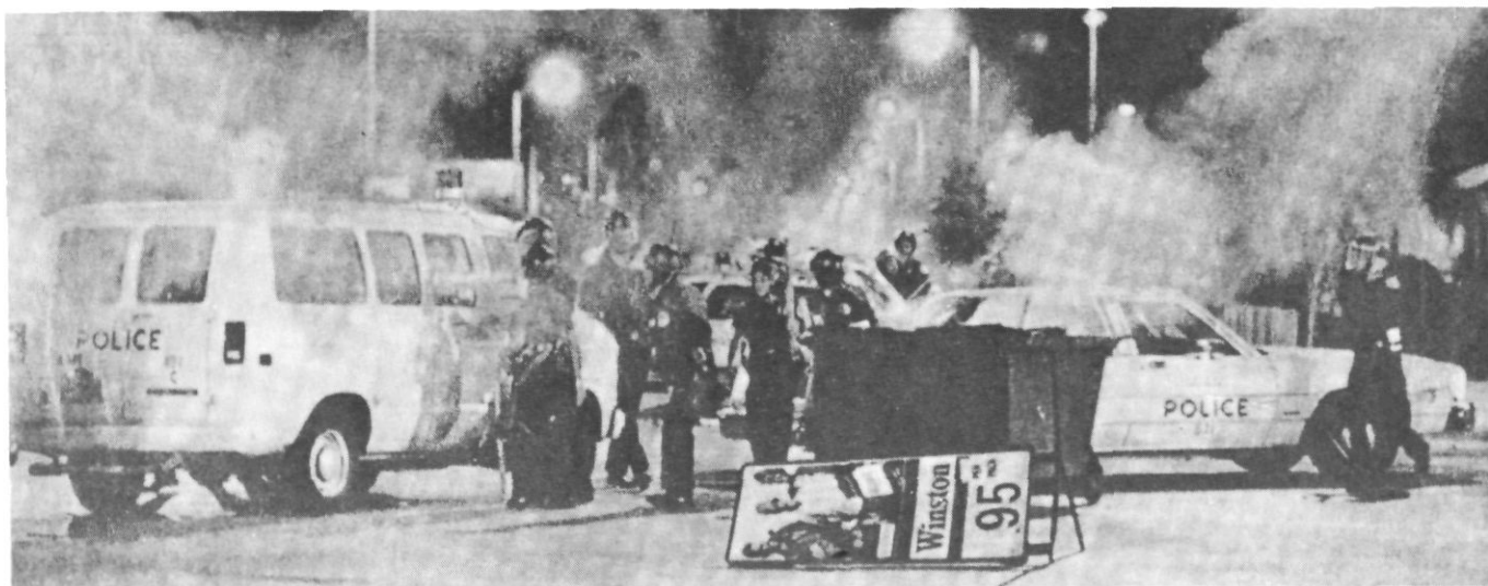
El «colonialisme interior» compta amb efectius eficaços.

perquè té lloc en el si dels territoris controlats per un mateix estat, com a fruit del domini d'aquest per la classe dominant d'una de les nacions que l'integren. Possiblement, el primer exemple de colonialisme interior (i el model per a tots els altres) al continent és França. La invasió dels territoris «colonitzats» es produeix a través de «guerres de religió» i comença al llarg dels segles immediatament anteriors al Renaixement.