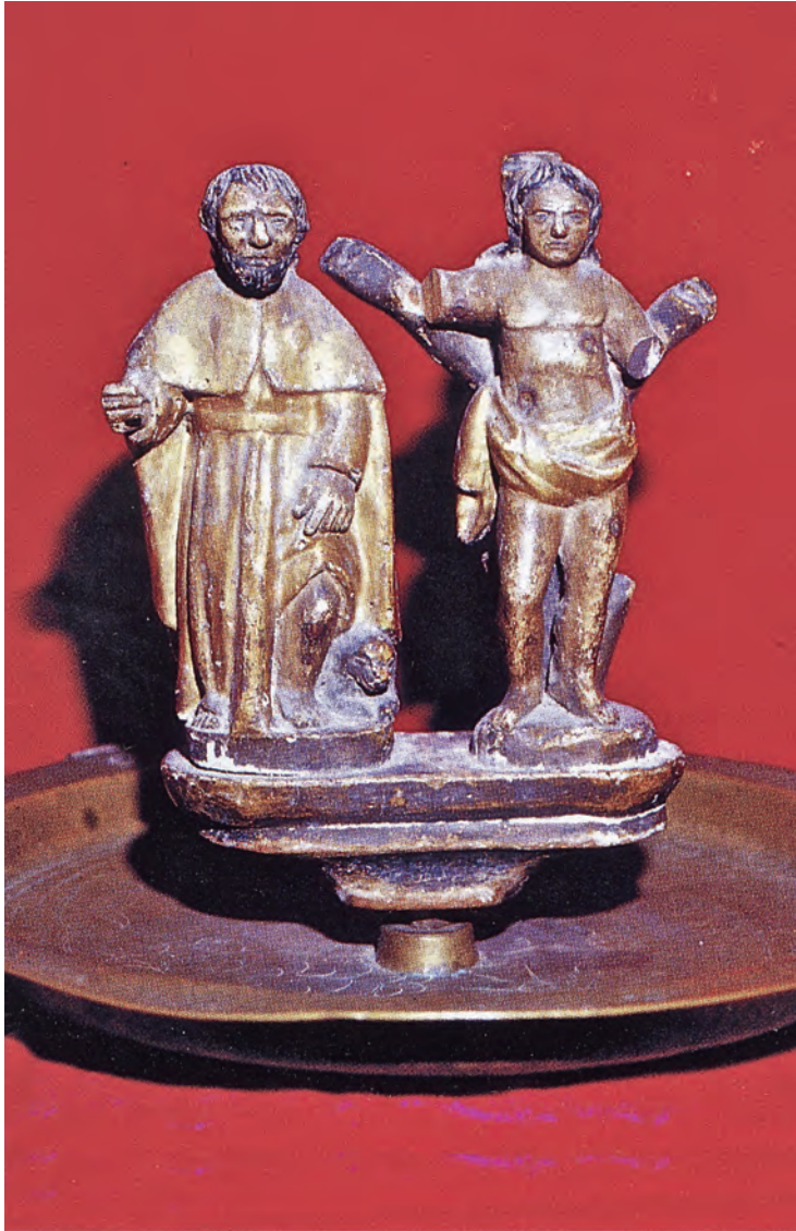
Almoïner datat al segle XVIII de l'església de Santa Eulària, al centre del qual s'han inserit les talles de sant Roc i sant Sebastià (Font: Set segles fa ).

diterrània. Entre aquests, els més importants varen ser la gran epidèmia de 1348, que va interrompre a l'illa el procés de creixement demogràfic iniciat en el primer quart del segle i va donar lloc a una profunda crisi socioeconòmica que va continuar fins a ben entrat el segle XV; 28 després, la de la primavera de