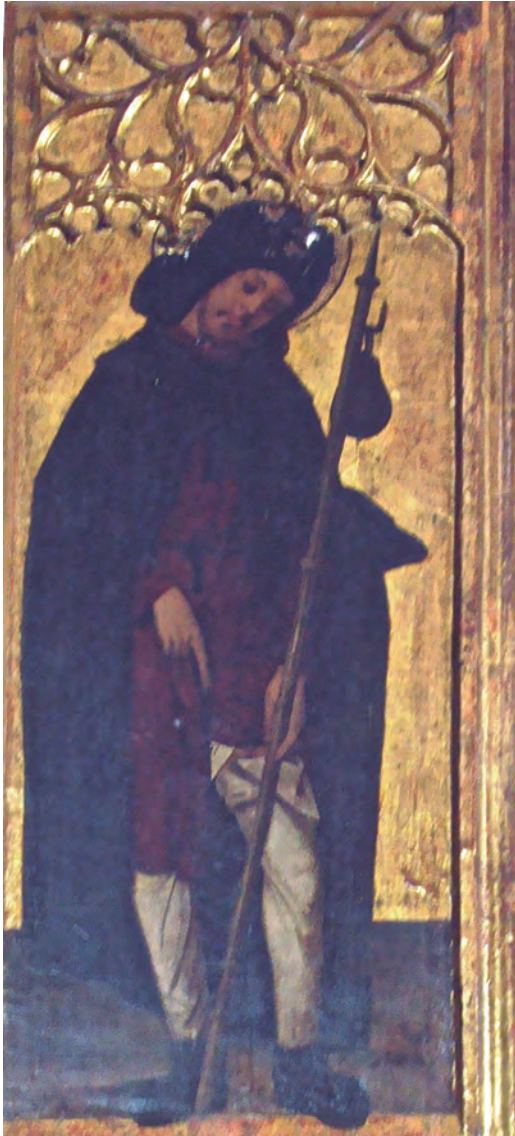
Representació de sant Roc mostrant la nafra a la cama, a la part inferior esquerra de la polsera del retaule de Nostra Senyora de Jesús.