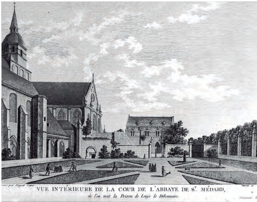
Vista, en un gravat del segle XVIII, del pati intern de l'abadia de Saint Médard, a Soissons, lloc on l'any 826 el bisbe Hilduin va traslladar algunes relíquies de sant Sebastià.

Reyes i Villaviciosa de Odón. A Castella i Lleó, Villacastín a la província de Segòvia. A Aragó, Larcovilla a la província de Saragossa. A la Comunitat Navarra, Tafalla. Al País Basc, Sant Sebastià a Guipúscoa. Però és als Països Catalans on el culte a aquest sant té una especial presència.