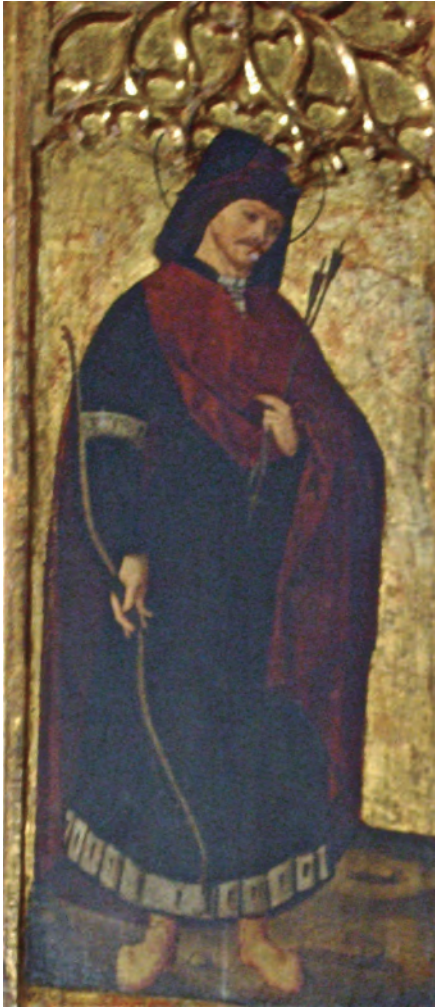
Representació de sant Sebastià com un cortesà vestit amb robes palatines, amb l'arc i les fletxes com a símbol del martiri, a la part inferior esquerra de la polsera del retaule de Nostra Senyora de Jesús.

del segle XVI. El sant apareix sobre un fons daurat i un terra fosc, vestint robes cortesanes i portant una sageta a la mà. L'acompanyen en la polsera, donant la volta al retaule, sant Onofre, sant Lluís de Tolosa, sant Vicent Ferrer, sant Joan Evangelista, Crist en Majestat, sant Antoni Abat, santa Caterina d'Alexandria, sant Nicolau de Bari, sant Bernat i sant Roc, a la part inferior dreta, quedant contraposat a sant Sebastià. Ja s'ha fet notar l'«esperit franciscà» del retaule, així com el fet que les escenes i molts dels sants i personatges representats eren habituals en el culte franciscà. Sant Sebastià era aleshores un d'aquests sants objecte de la devoció franciscana, 17 i no oblidem que l'església de Nostra Senyora de Jesús, edificat a