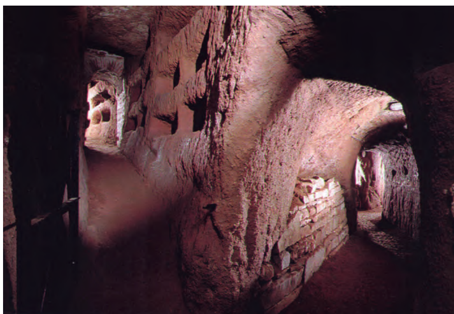
Catacumbes de Sant Sebastià, a prop de la via Àpia, a Roma. Detall d'alguns passadissos, el superior amb nínxols oberts a la paret per acollir enterraments de cristians.

El culte a aquest sant va començar aviat. Hi ha indicis que en origen podria haver-se tractat de la cristianització d'un culte pagà anterior, dedicat a la divinitat de l'emperador. Fins i tot, alguns autors relacionen el culte a Sebastià amb un culte al déu Apol·lo, ja que antigament es relacionaven les epidè-