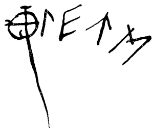
Le graffiti ibérique d'Osséja.

— Au «Replà del Genevri», sur la face verticale du rocher, on voit un cerf schématique, à la tête ornée d'immenses bois, associé à un petit personnage schématique; parmi un réseau de lignes entrecroisées, on devine un très grand cerf de même style; un arboriforme et sur les rochers voisins, des signes en soleil et une arbalète. Sur le même site, nous avons relevé un graffiti de cinq lettres qui semblent