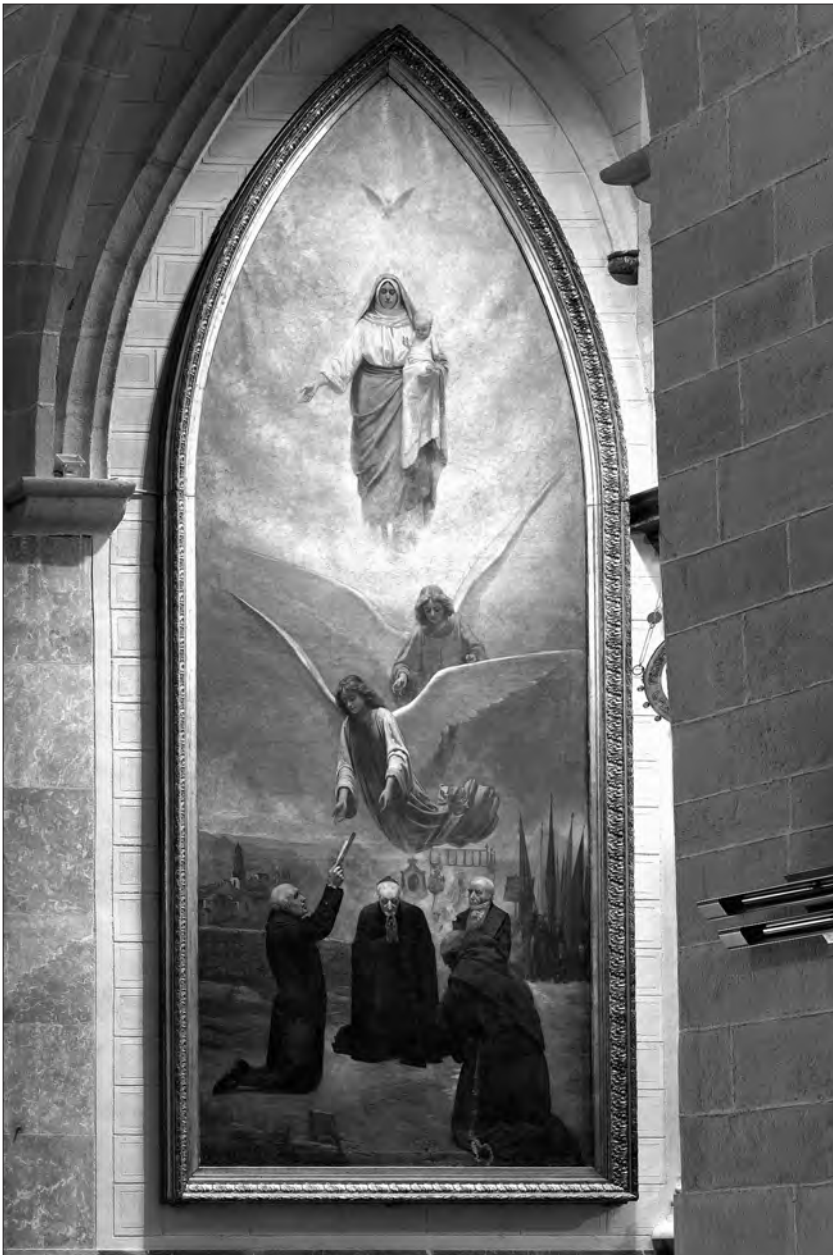
L'any 1890 els obrers de la Candela van encarregar al pintor valenc Francisc Galofre Oller dues pintures de grans dimensions per omnar la capella de la Mare de Déu. Els dos quadres van ser pintats presentats per les Festes Decennals de l'any 1891 al santuari del Lledó. En la fotografia podem veure el quadre al·legòric a la fundació de les Festes Decennals. (Parròquia de Sant Joan / Foto Pere Queralt)