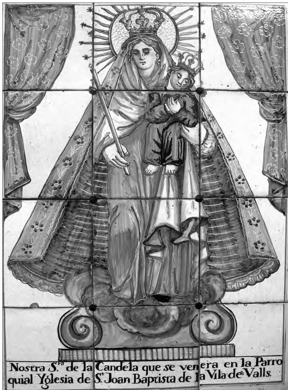
Una de les representacions més antigues de la Mare de Déu de la Candela que s'han conservat la trobem en aquest plafó de rajoles, de finals del segle XVIII o principis del segle XIX, provinent de la cuina de la casa Jové.