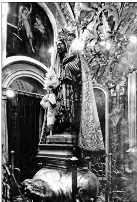
Dues fotografies de la imatge de la Candela al seu cambril, portant el seu mantell. (AMV)