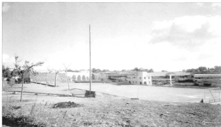
El camp de futbol del Vilar i la piscina durant els anys quaranta.