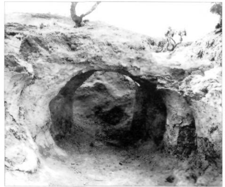
Una altra imatge del forn tal com es va descobrir l'any 1920.