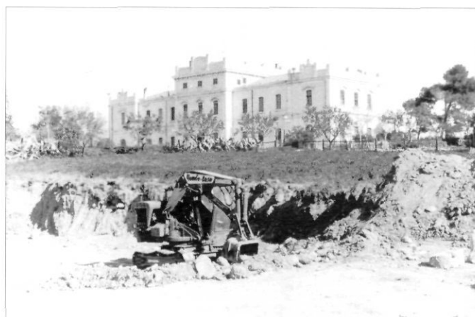
Treballs de construcció de la futura escola Eugeni d'Ors, 1966.