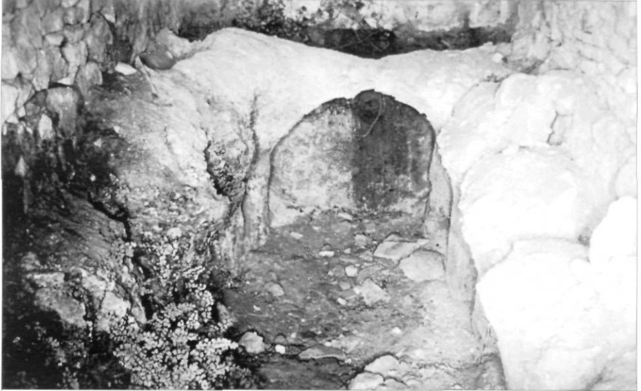
El forn als voltants de 1967.