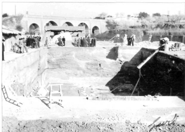
Obres de construcció de la piscina del Vilar. Anys quaranta.