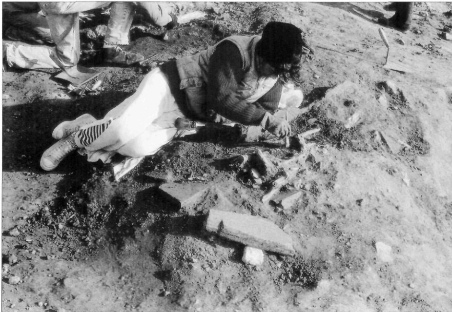
Una imatge de les excavacions de la necròpolis de Mas Gassol, a Alcover.

Notícia del descobriment i l'excavació d'una necròpoli romana al terme municipi-