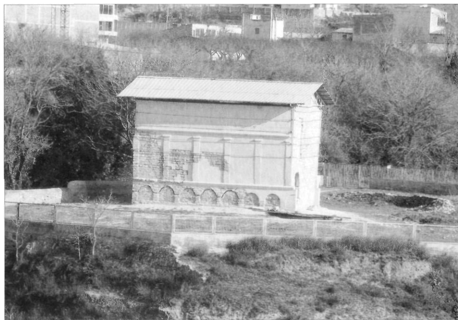
El columbari de Vila-rodon abans i després de la seva restauració.