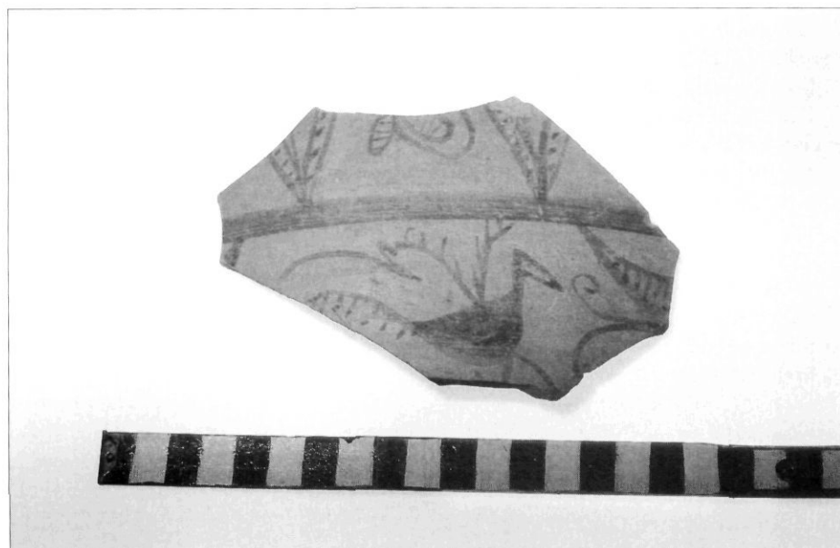
Decoració d'au en un fragment de kalathos del jaciment del Vilar (Valls), conservat al Museu Arqueològic de Barcelona.