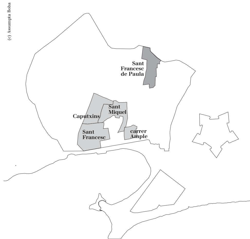
Figura 2. Llibres d'Alcalde de Barri. Barcelona, 1770

Els Llibres dels Alcaldes de Barri són l'única documentació de caràcter municipal sobre composició i estructura de llars que es conserva per a finals del segle XVIII. Malauradament, només s'han conservat per a cinc dels quaranta barris de la ciutat (Figura 2). El procés de selecció del barri a estudiar ha estat fàcil, ja que tots els estudis disponibles ens conduïen cap al quarter de Sant Pere, una àrea amb alta densitat de població treballadora, forta localització de fàbriques d'indianes i valor mitjà dels crèdits per carrer més baixos. 5 Aquest darrer aspecte corroborava la nostra hipòtesi entorn a l'extensió del microcrèdit (Figura 3).