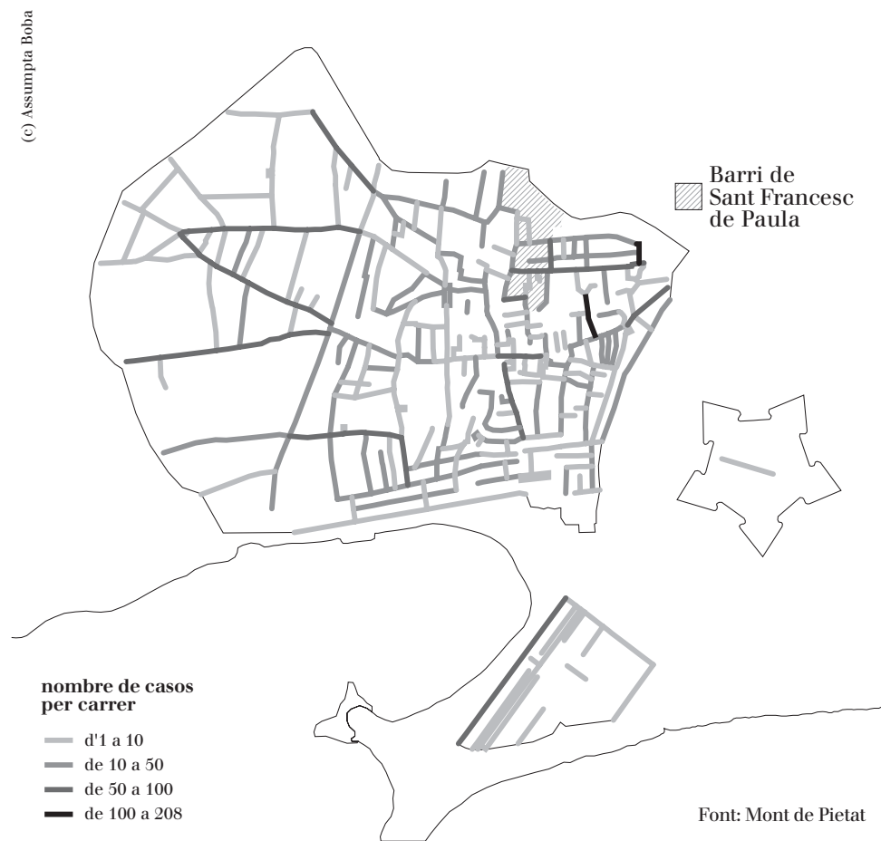
Figura 4. Barcelona 1770. Total prestataris/prestatàries segons carrer de residència