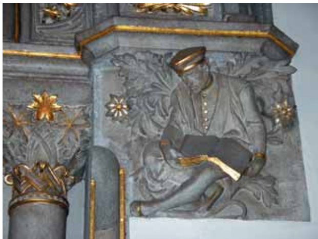
Detall escultòric de la imposta exterior dreta de les arquivoltes de la porta principal del Paraninf de la Universitat de Barcelona.