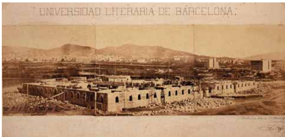
Estat de la construcció de la nova Universitat el dia 15 de febrer de 1865, certificat per l'arquitecte Elies Rogent al peu d'una fotografia de M. Sala (Fotografia: Arxiu Fotogràfic de Barcelona).

Mentrestant, però, el mateix arquitecte, insatisfet amb el disseny de la façana principal, en va fer una nova proposta, més monumental, que coronava la façana amb una alta torre, i la va presentar el 20 d'abril de 1867. L'Acadèmia de San Fernando va posar dificultats al projecte i, finalment, el 18 de febrer de 1868, s'acordà la solució definitiva. 18