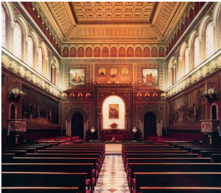
Perspectiva actual del Paraninf de la Universitat de Barcelona, presa des de l'accés principal en direcció a la presidència.

El mur és decorat amb un elaborat treball de guix policromat. Unes grans finestres situades a la part superior permeten il·luminar l'espai. A la testera hi ha dues grans pintures, a banda i banda del dosser central, amb al·legories de les lletres i les ciències i tres medallons amb els retrats de Carles V, Isabel II i Alfons el Magnànim i, en els laterals, sis grans pintures de tema històric. Entre les pintures i els finestrals que envolten tot el saló, incloent la barana del cor, se situa una franja de medallons amb retrats: per damunt de la línia de finestres, una nova franja amb inscripcions; i més amunt encara, una galeria cega correguda amb arcs lobulats que allotja els noms de personatges cèlebres.