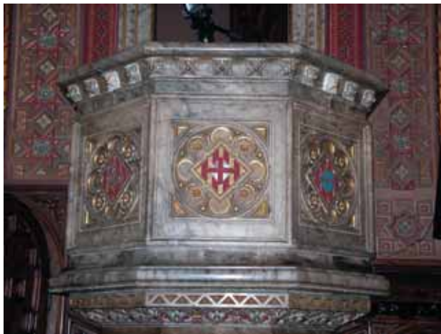
Detall d'una de les dues trones dels lectors al Paraninf de la Universitat de Barcelona (Fotografia: Mireia Freixa).

Cita el model que va originar aquest estil, el primer renaixement, i ho fa per la mateixa raó que havia interessat els arquitectes germànics: perquè és «acorde con los grandes ideales que debía expresar», els ideals civils dels models florentins. Amaga –no hi ha dubte– el veritable origen del model i busca a més uns orígens autòctons que són falsos; és a dir, hi afegeix una argumentació patriòtica fent extensiva al primer renaixement la visió que els artistes i arquitectes romàntics tenien de l'estil gòtic. La justificació de Rogent resulta encara més confusa si pensem que, a Catalunya, només la façana nova del Palau de la Generalitat de Pere Blai (1596-1619) presenta una imatge exterior inspirada en els palaus florentins.