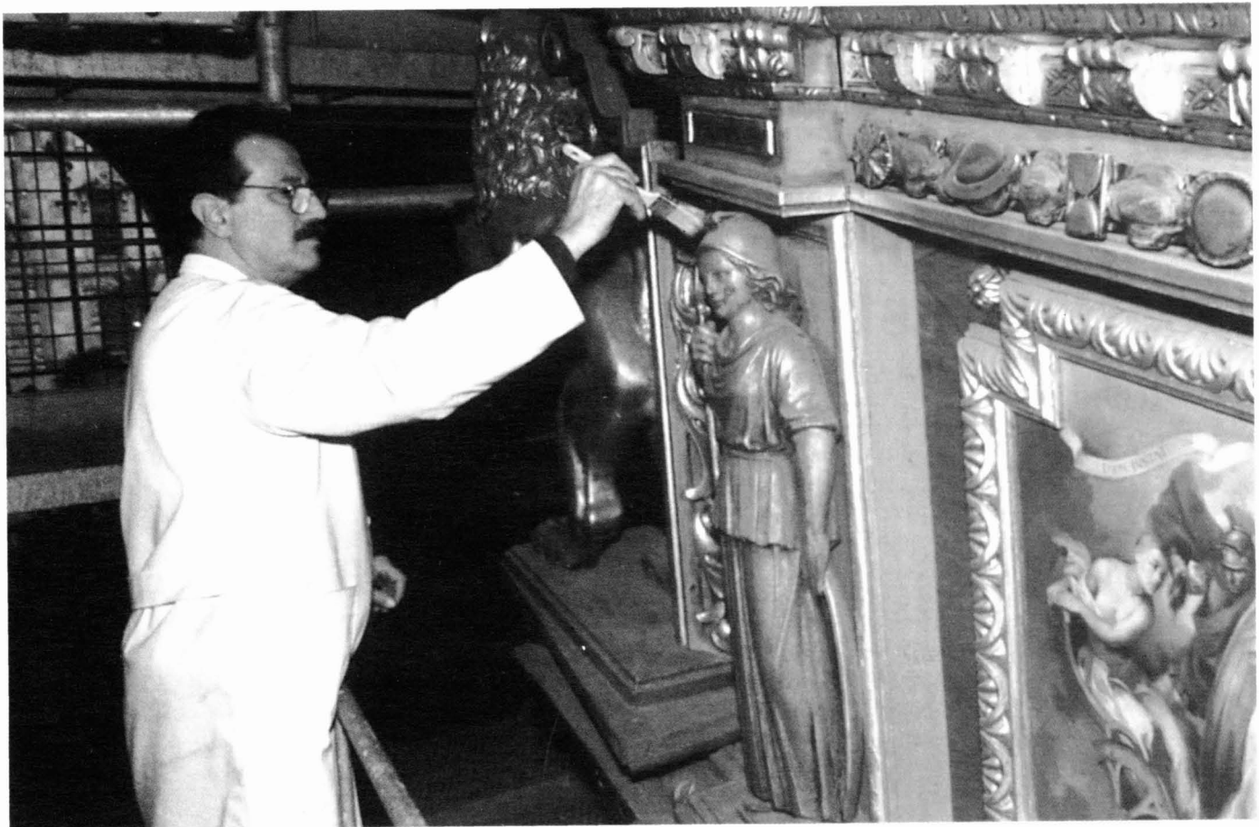
Eliminació de la pols amb paletines

les dues pintures de l'arrumbada, les quals, per la seva posició inclinada, havien rebut pols pràcticament des del moment de fer-les. La brutícia havia penetrat dins la pintura i l'havia cobert fins quedar gairebé oculta.