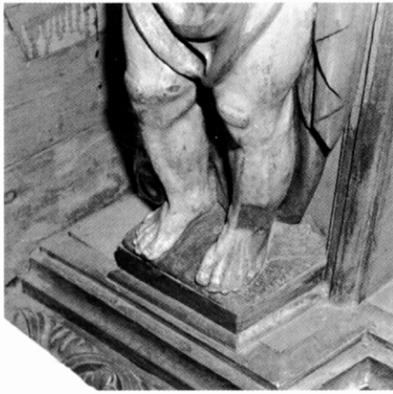
Detall de la neteja de la capa pictòrica a una de les talles de la banda sinistra