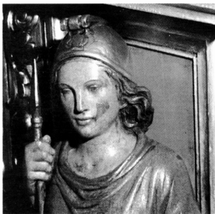
Detall de la taca fosca produïda per la resina de la fusta

també per dotar-la d'una nova imatge més d'acord amb la demanda de la societat actual.