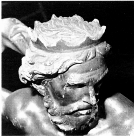
Mostra de pèrdues de la capa de preparació per efecte de la humitat