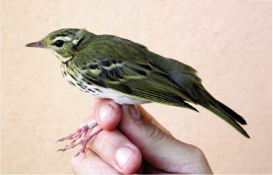
Foto 7. Titina d'esquena olivàcia Anthus hodgsoni (Olive-backed Pipit), mostra trets de la subespècie yunnanensis . Cabrera, octubre de 2007.