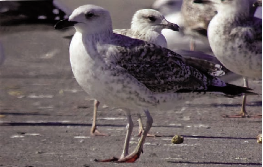
Foto 5. Gavinet Larus marinus (Great Black-backed Gull), au de segon any calendari. Port de Palma, abril de 2009.