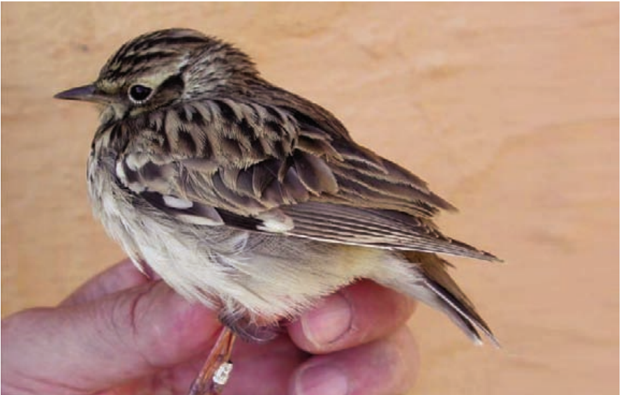
Foto 6. Cotoliu Lullula arborea (Woodlark). Cabrera, octubre de 2009.