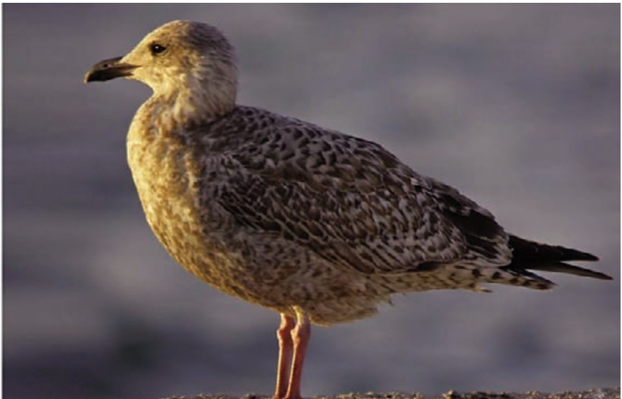
Foto 4. Gavina atlàntica Larus argentatus (Herring Gull), ocell de primer any. Port de Palma, octubre de 2009.