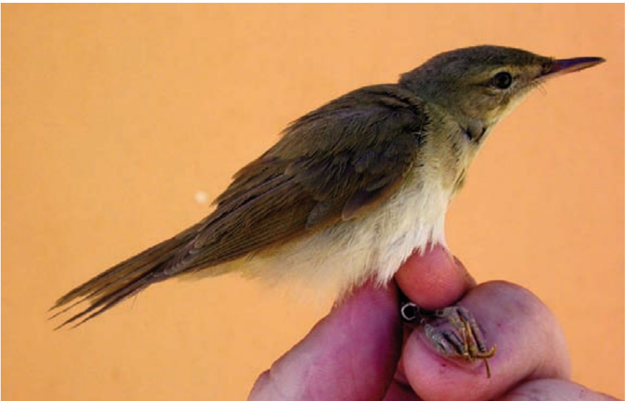
Foto 8. Boscarla de Blyth Acrocephalus dumetorum (Blyth's Reed Warbler), immadura de primer hivern. Cabrera, octubre de 2007.