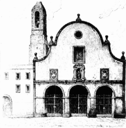
Figura 3. Façana de l'església del Convent de Sant Josep.