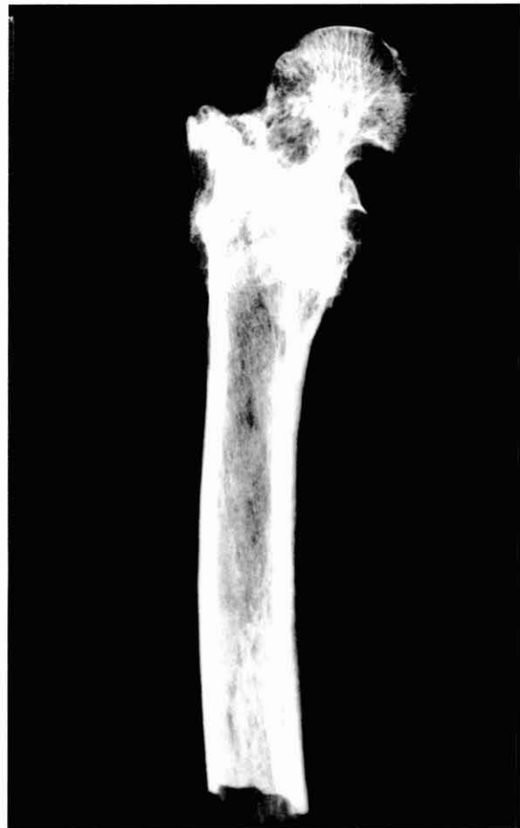
Figura 5. Traumatisme per enclavament del coll del fémur en l'individu senil de l'E.F. 34. Imatge radiogràfica.

La guarició degué ser bona, tot i que el subjecte conservés un caminar defectuós.