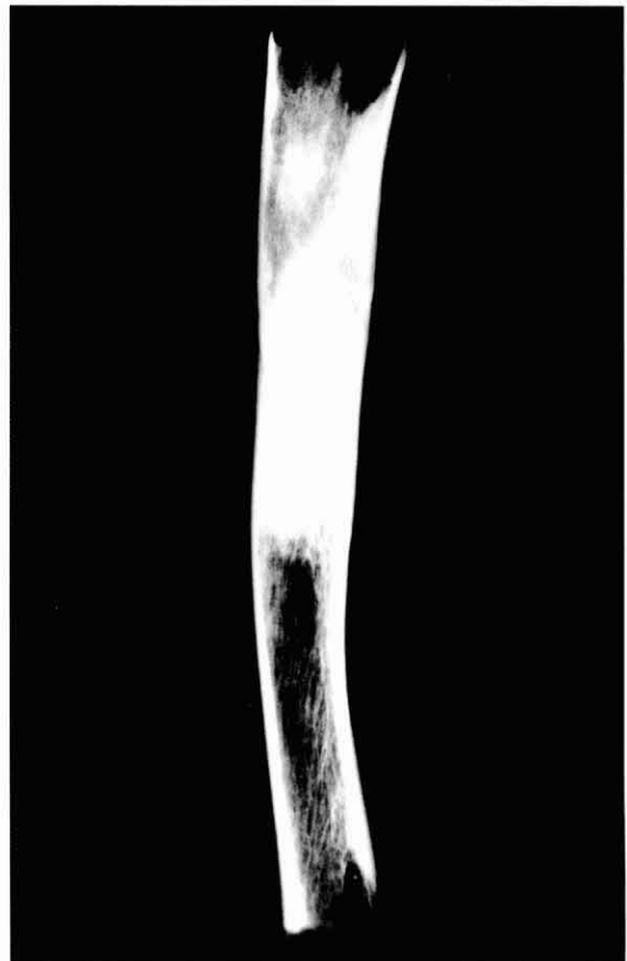
Figura 7. La imatge radiogràfica de la mateixa tibia mostra alteracions a nivell de condensació trabecular, amb zones de condensació òssia junt amb altres de descalcificació, trets propis de la malaltia de Paget.

E.F. 26, 1 (40-60): Presenta dues cavitacions en la fossa occipital esquerra, en posició parasagital. La superior, lobulada, comunica l'endo amb l'exocrani, mentre que la inferior, molt petita, només comunica amb l'endocrani. To i que el si venós occipital és inconstant, en el cas en estudi creiem que devia existir ja que, en les proximitats del foramen magnum s'emmarca un solc en un sector d'uns 18 mm. La nostra opinió és que ambdós orificis devien estar en comunicació amb el si occipital i que el superior, per estar en comunicació amb l'exocrani, devia originar un sinus pericrani. La radiografia mostra la nitidesa d'aquestes cavitats que, des del punt de vista patològic, també podria obeir a altres etiologies, com per exemple un lipoma, un condroma intraossi, un cisticerc, etc. No obstant, pensem que és més probable que es tracti d'una anomalia vascular.