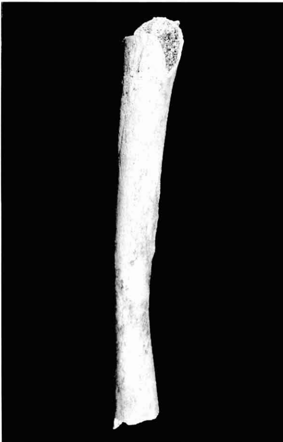
Figura 6. Tibia dreta provinent del nivell remenat superficial. Són evidents l'engruiximent exostòsic i la incurvació anormal de la diàfisi.

E.F. 8, ind.1 (infantil 9-10): cribrà unilateral E.F. 14, ind.1 (masculí 40-60): cribrà unilateral E.F. 25, ind.1 (femení 20-40): cribrà bilateral