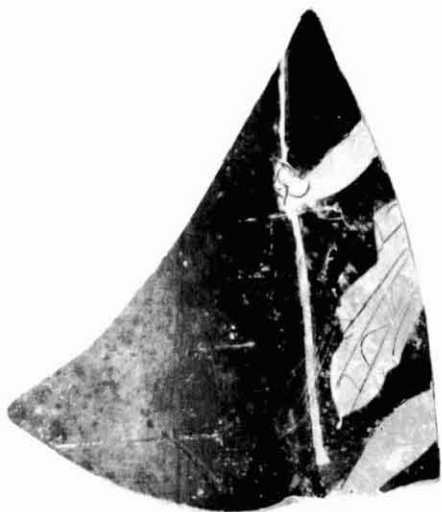
Figura 13. Crater de calze.