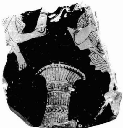
Figura 15. Tapadora de làcane.