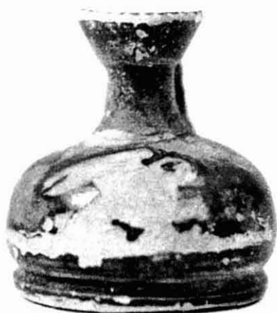
Figura 17. Lècit panxuda.

Empúries es poden adscriure als tipus A i D. La major part (8 exemplars) es daten al segle V aC i es poden comptabilitzar quatre pixides i quatre tapadores, resultant un nombre mínim d'individus de quatre. Del segle IV aC s'han recuperat dos fragments de tapadora de pixis (Fig. 16).