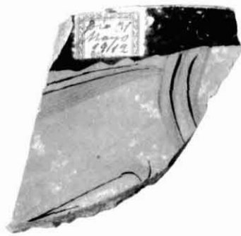
Figura 11. Plat de peix.