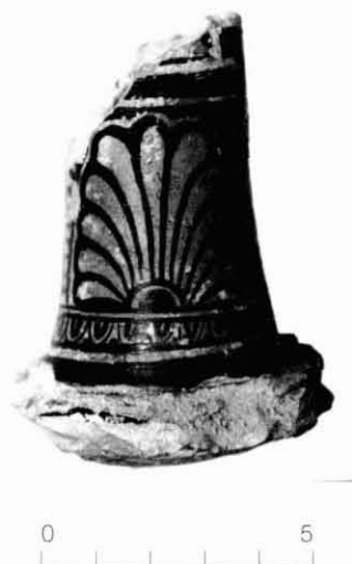
Figura 18. Lutròfora.

Lècit panxuda: Dins d'aquest tipus hem diferenciat algunes variants: