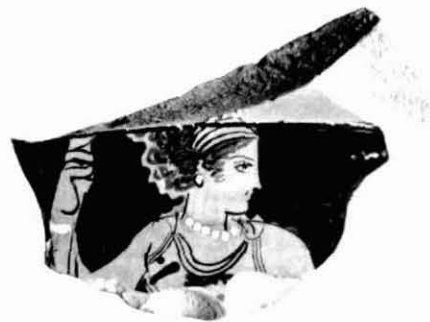
Figura 12. Crater de campana.