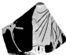
Figura 5. Cílix-escif.