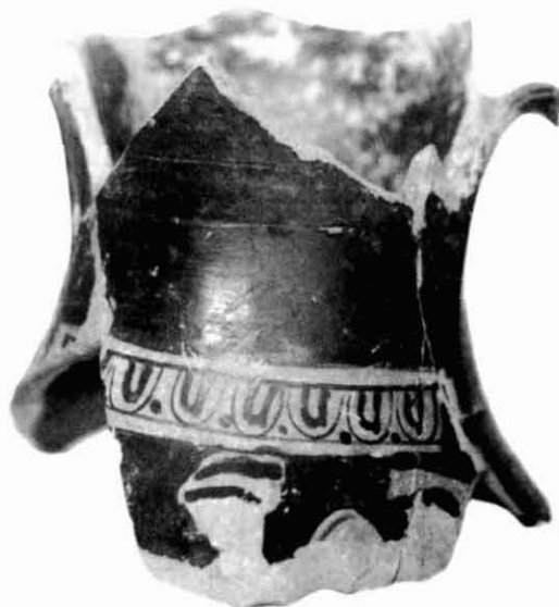
Figura 14. Pèlice.