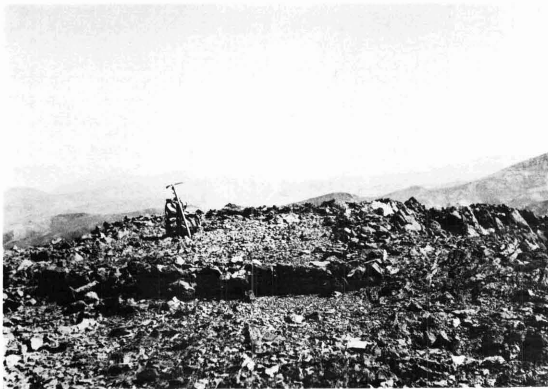
Fig. 1. — Explazo en la cumbre del Cerro Mogotes (5.380 m.), extremo norte de la provincia de San Juan. Sitio ceremonial incaico.

de la Cayana, excavó restos correspondientes a cazadores tardíos. En otros sitios de La Colorada de la Fortuna excavó niveles de agricultura temprana y media correspondientes a culturas trasandinas.