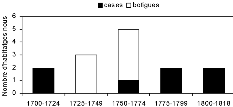
Figura 3. Establiments per a habitatges a Castelldefels al segle XVIII. 33