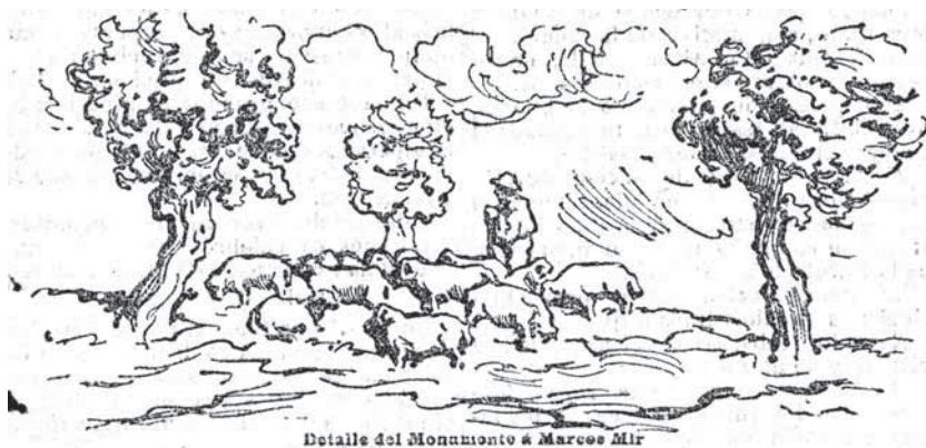
Figura 3: Detall del Monument a March Mir de Sant Sadurní d'Anoia que mostra un ramat de moltons tarragonins