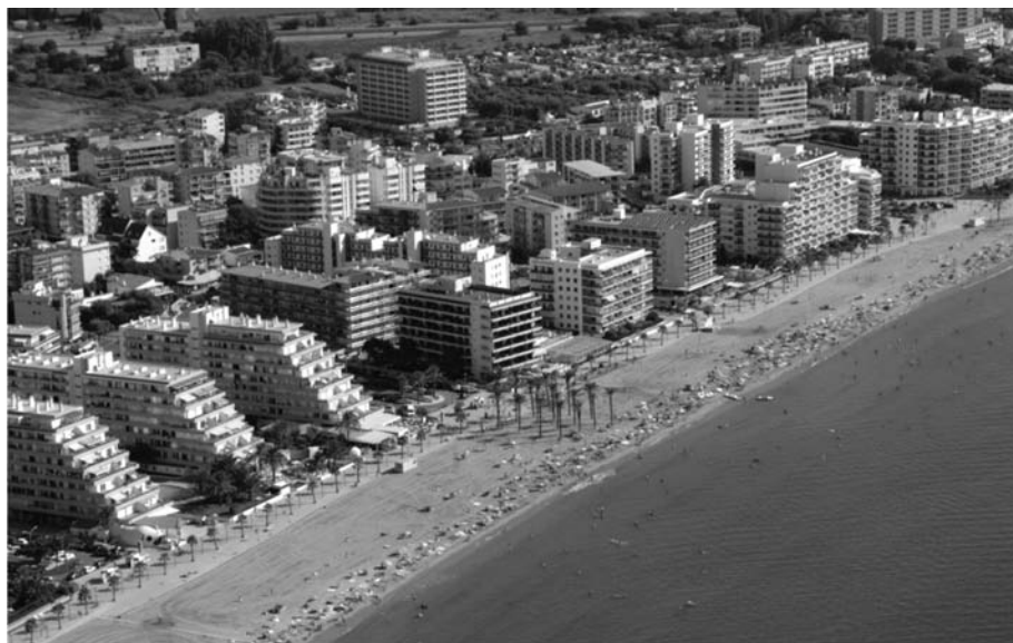
Santa Margarida, El Salatar (Roses).

En general, l'ocupació urbanística del litoral empordanès va seguir tres models diferenciats. Un primer és aquell que va partir del creixement natural dels nuclis tradicionals situats arran de la línia de costa: per exemple, Roses,