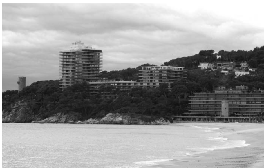
Urbanització Torre Valentina, Sant Antoni de Calonge (2007), aprovada el 1956. Carolina Martí.

En el marc d'una política centrada en el binomi turisme-construcció, més que en el sector turístic pròpiament dit (d'allotjament comercialitzat: hotels i/o càmpings), les urbanitzacions de segona residència s'han convertit en les protagonistes principals de l'oferta i en l'element més visible de la transformació produïda en el paisatge del litoral empordanès. Les urbanitzacions s'han estès arreu, sobretot en aquells llocs que gaudeixen de vistes panoràmiques sobre el mar i la platja. Els municipis més afectats per urbanitzacions de baixes densitats són els de Cadaqués, Roses, Torroella de Montgrí, Begur, Palafrugell, Sant Feliu de Guíxols i Santa Cristina d'Aro. I els municipis més afectats per urbanitzacions d'altres densitats són els de Llançà, Roses, Castelló d'Empúries, l'Escala, Palafrugell, Calonge i Castell-Platja d'Aro. A més, sovint es van construir urbanitzacions més grans de les projectades.