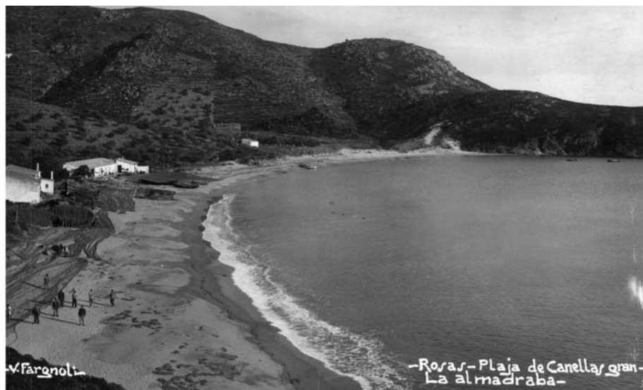
Canyelles Grosses, Roses, 1920-30.

La burgesia provinent de les principals ciutats properes a la costa empordanesa també es varen començar a construir cases d'estiueig senzilles