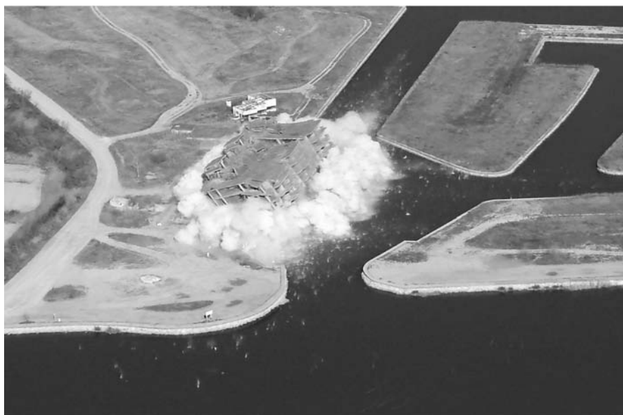
Fluvianàutic, 23 de febrer de 2005 (Sant Pere Pescador). (www.fotosaeries.com)

Un altre exemple significatiu és el projecte de desurbanització dels vials de la zona de la Pletera (l'Estartit), iniciat l'any 2008, i que culmina recentment, gràcies a un projecte LIFE, amb la recuperació dels aiguamolls d'aquest paratge. La urbanització de la Pletera es va començar a construir entre els anys 1986 i 1988, i es va aturar el 1992 per fallida de l'empresa, quedant els vials abandonats. El 1997 l'interès del salicornar va fer aturar les llicències d'obres i, finalment, el POUM del 2002 va desclassificar 220.000 m 2 de sòl edificable. La recuperació dels aiguamolls de la Pletera, juntament amb els del Ter Vell, i juntament amb les illes Medes i el Montgrí, pot