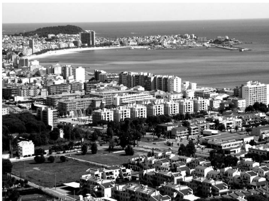
La pantalla i el contínuum urbà. Badia de Palamós i Sant Antoni de Calonge, 2005. Carolina Martí.

Un dels efectes més destacats del procés de transformació del litoral empordanès, a causa de l'arribada massiva de turistes, va ser la litoralització. La recerca de la proximitat a la platja i el mar i el desig de gaudir el més a prop possible de l'entorn marítim va originar una progressiva tendència a ocupar l'estreta franja costanera, renunciant al creixement en taca d'oli i a l'ocupació del rerepaís. Així, els nuclis urbans preexistents van començar a expandir-se paral·lels a la línia costanera sobre els territoris adjacents a la trama urbana ja existent, en detriment de zones agrícoles i/o humides d'alt valor ecològic i ambiental, formant continus urbans. A més, a partir d'una tipologia arquitectònica d'edificis en pantalla i gran volumetria es varen potenciar les altes densitats i la verticalitat. Els sectors on s'observa millor el fenomen de la litoralització són en els de Roses, l'Escala i en el sector que s'estén des del port de Palamós fins al turó de Sant Elm, a Sant Feliu de Guíxols.