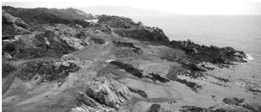
Del Club Med (a dalt) al pla de Tudela (a baix). (www.arquitecturayempresa.es)