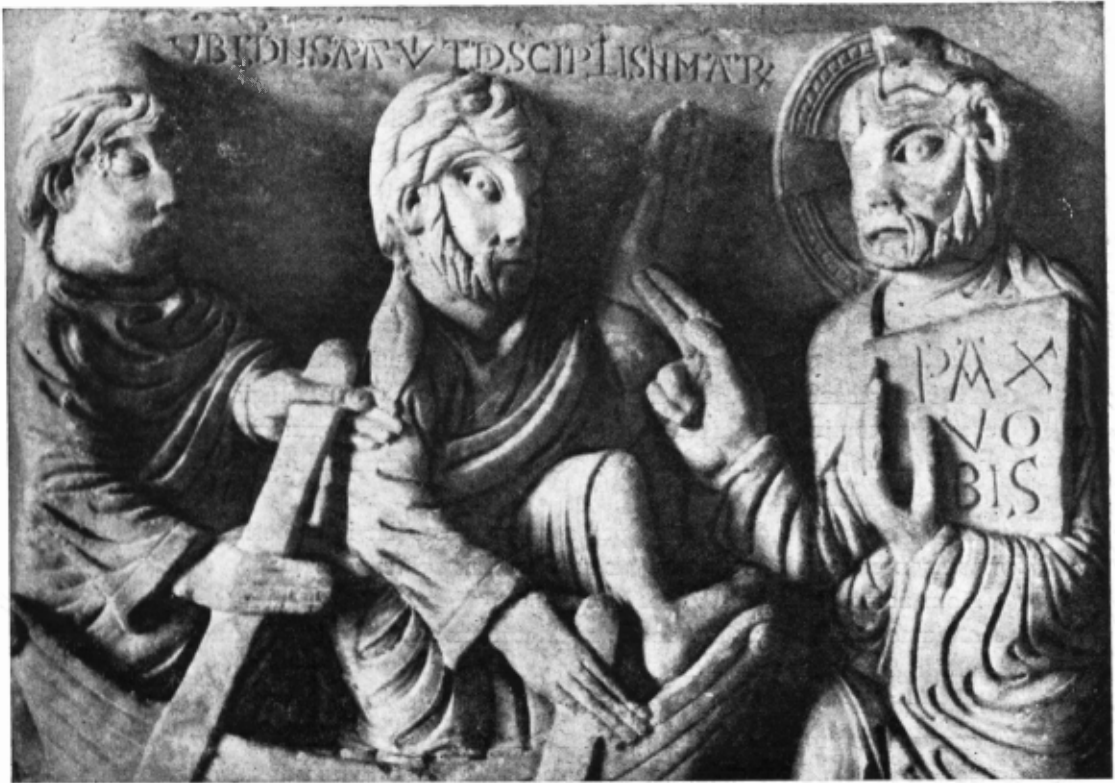
Detall del relleu on culmina l'art del Mestre de Cabestany