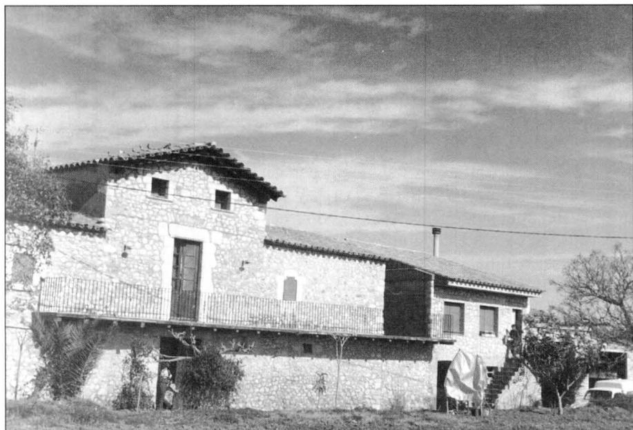
Mas Ribas (suposat mas Soler).