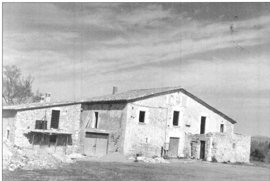
Can Vilar (en procés de restauració. Ha conservat el seu nom).