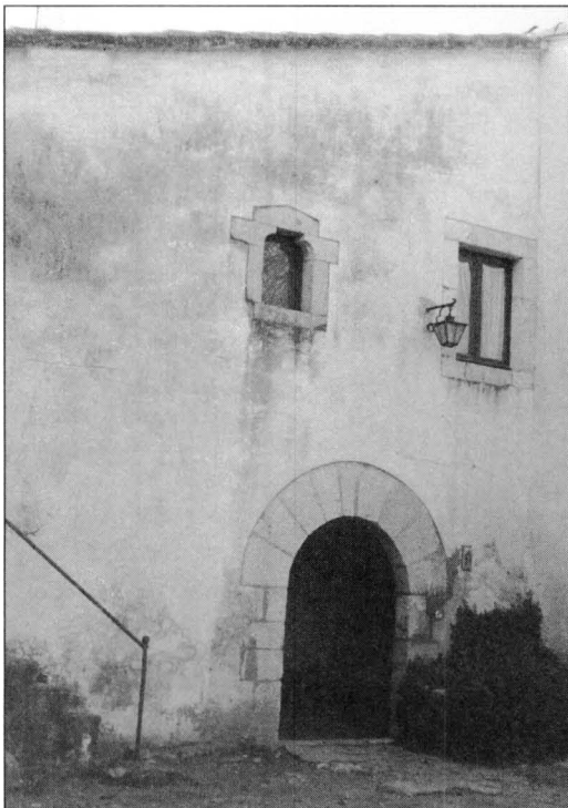
Mas Sagols (per bé que al segle XVIII es coneix per mas Sans, ha recuperat el seu nom primitiu).

Finalment, ens sentiríem satisfets si la informació que presentem en aquest treball, en algun moment, pogués ser d'utilitat a algun estudiós.