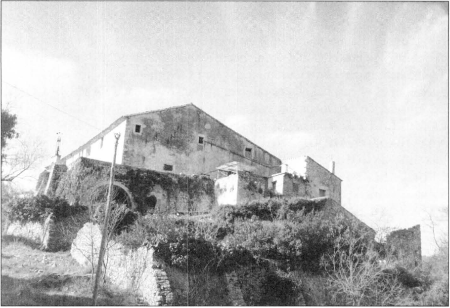
Can Rissec (suposat mas Duran)