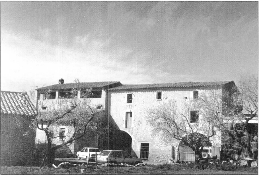
Can Falgarona (Suposat mas Narbona)