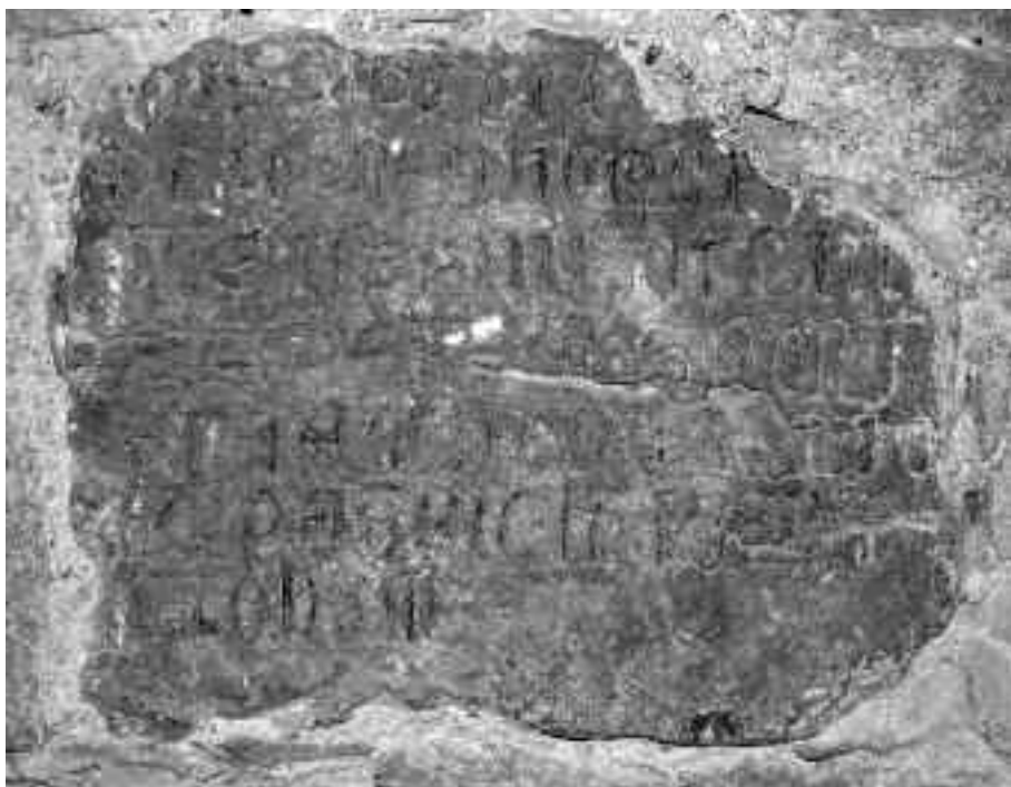
Fotografia de la inscripció conservada al santuari de la Mare de Déu del Mont.