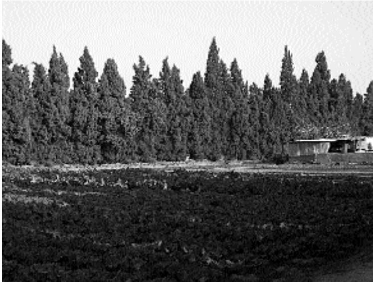
Paisatge humà. Hort amb tanca de xiprers.