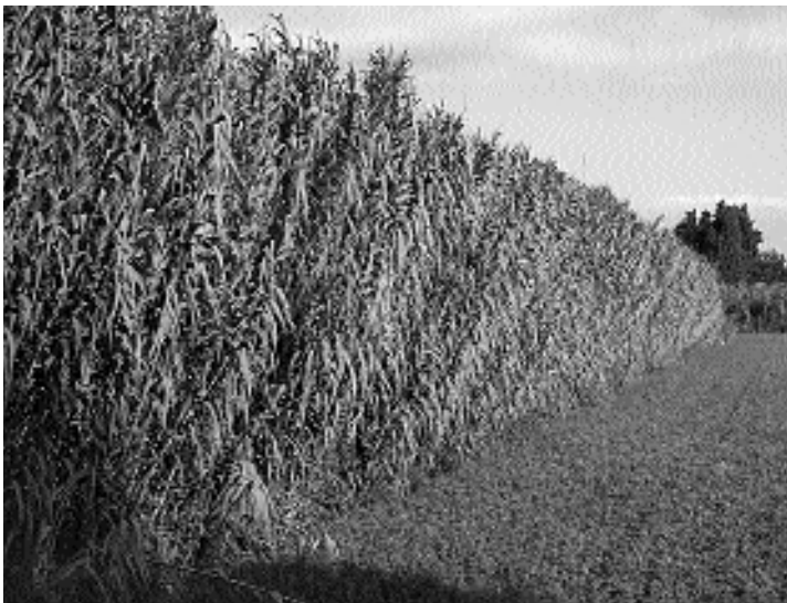
Paisatge humà. Canyar en el límit de camps.

Serveixen per a fer-ne canyes de pescar i perxons per a batre les olives, així com per a penjar el raïm picapolla, per tal d'assecar-lo i fer-ne panses. Les primes (n'hi ha de dos tipus, una ve més grossa) van bé per a fer-ne canyes de pescar perquè prop de la base tenen uns anells que eviten que la canya s'escapi dels dits si els peixos piquen.