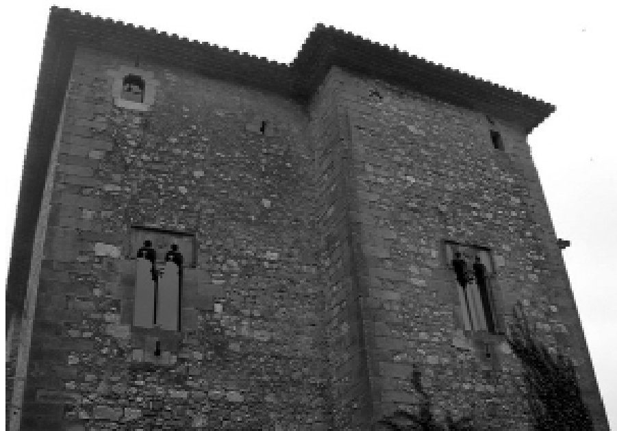
Detall del mur septentrional del castell de Sant Mori amb dues finestres geminades. La que està situada a la dreta té l'escut dels Cardona esculpida.