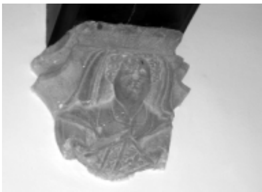
Mènsula de l'interior del castell de Sant Mori on es pot veure, a l'escut, les armes dels Rocabertí a l'esquerra i dels Cardona a la dreta.