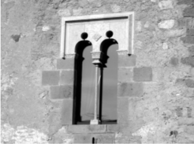
Detall d'una finestra geminada en el mur meridional del castell de Sant Mori. Tot i que és de fàbrica actual conserva l'escut d'armes dels Rocabertí.