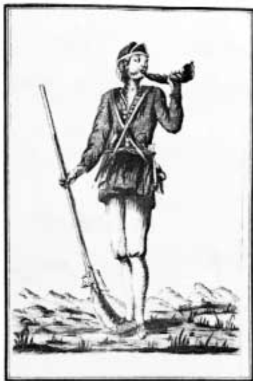
Miquelet català (1770).

van ganandonos baterías, ya aprisionando a unos y degollando a otros; y últimamente en un instante quedó enteramente derrotado nuestro ejército, luego que su mando cayó en manos del Marqués de las Amarillas, (51) el qual hubiera querido ya transferir luego su cuartel general en Barcelona. En fin entró el francés en Figueras, cuyo maravilloso castillo gobernado por el infame Torres (52) se rindió (53) a 2 días (p. 19) de sitio sin disparar un cañón . Sin embargo de estar abundantemente abastecido de un todo; entregándose prisionera de guerra la guarnición que passaba de 9 mil hombres, casi los más bizarros del