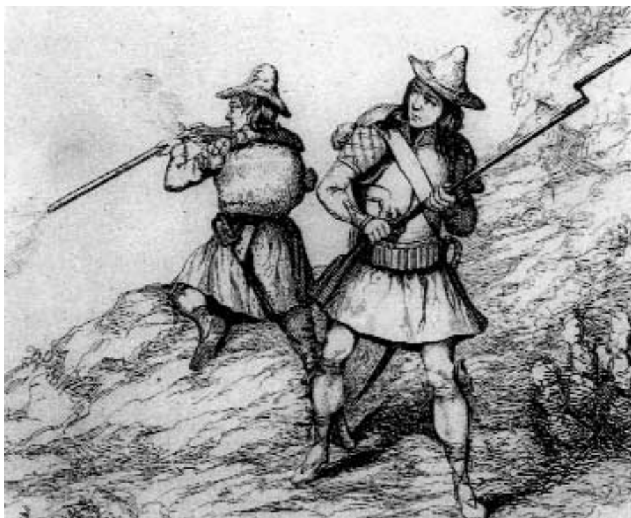
Miquelets catalans en 1793. (Gravat de Leuber, en La France militaire, segle XIX. Archives départementales des Pyrénées-Orientales).

Sin embargo, estos apuros hubieran sido soportables, como se hubiesen dexado illesas las suredas , prados y campos. Pero la poca atención y respeto de los arrieros permitía que los animales comiesen no poca parte de los trigos sembrados, y todo un campo de hierba bastante dilatado que guardaba la casa para la manutención de varios ganados lanares y bacunos que siempre ha acostumbrado tener; de que resultó una total penúria y escasez de víveres para los otros animales de la casa. A más de que por ser (p. 8) tan rápidas las subidas y baxadas de la nueva carretera de coll de Portell, era preciso que en las baxadas se atase la una rueda de los carros para que no se despeñasen cargados con tanto peso, por lo que aunque en los de más peso acostumbraban