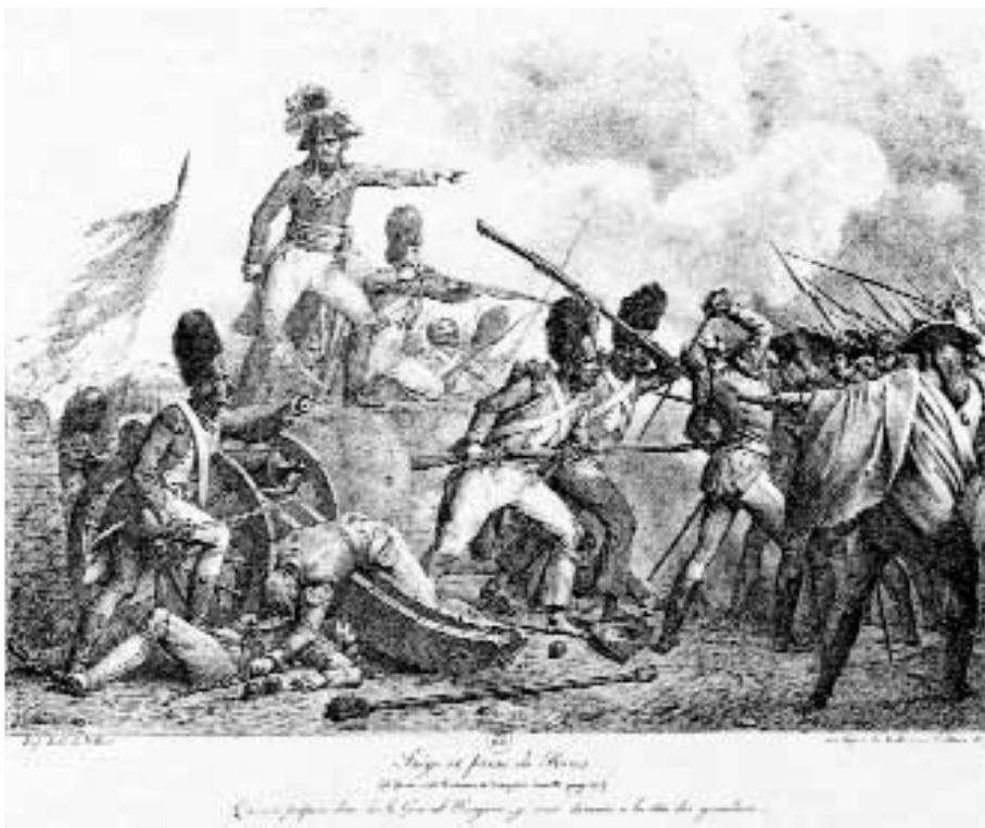
Gravat francés de 1819; Sitio y toma de Rosas (3-II-1795). El general Pérignon dirigiendo a las tropas. (Biblioteca Nacional, París).

(p. 3) que ellos se avían forjado, y con la igualdad que procuraban, avían formado una anarquía tumultuante, en que no reinaban sinó discordias y confusiones. El hijo quería mandar igualmente como el padre, y el criado ya no respetaba a su señor conforme lo permitían los principios de la igualdad pretendida. Con estos presagios de independencia avía ya llegado la Francia al colmo de la infelicidad. Los ministros del santuario son el objeto de la irrisión y del oprobio; unos cobardemente se amedrentan, otros sufren constantemente unas tragedias tan amargas. Parte del pueblo reconoce ya sus engaños, y los mismos que de antes fomentaban la anarquía, gritan ahora por monarquía. Se dividen los franceses mismos, y se levantan unas guerras civiles tan sangrientas, que ellas mismas parece son el instrumento con que la divina justicia quiere vengar la muerte de un Rey inocente. Pero no pararon aquí los terribles efectos de aquel horrendo asesinato, pues en medio de tantos ahogos se enfurecen contra Francia las potencias todas (p. 4) para castigar tantos insultos a la Real persona... Empieza el Emperador con la Rúsia y la Prúsia, sigue luego Inglaterra y Portugal; y finalmente la España aliada con estos y otros reinos, circuyen todos a la Francia de fuegos y espadas.