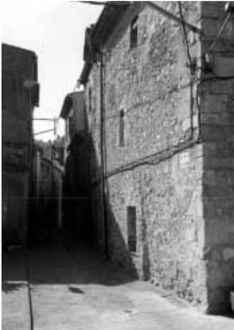
Carrer de la Salvetat, entrada a l'antic recinte de la Salvetat del Sant Sepulcre, vist des del carrer Major de la Vila de Terrades.