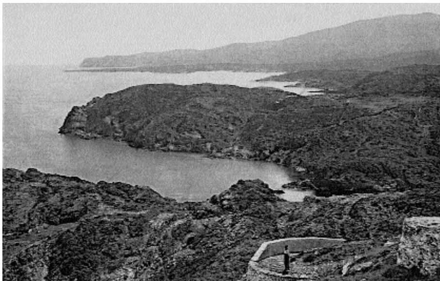
Costa Brava. Cadaqués. Cap de Creus. Mar de Vall.