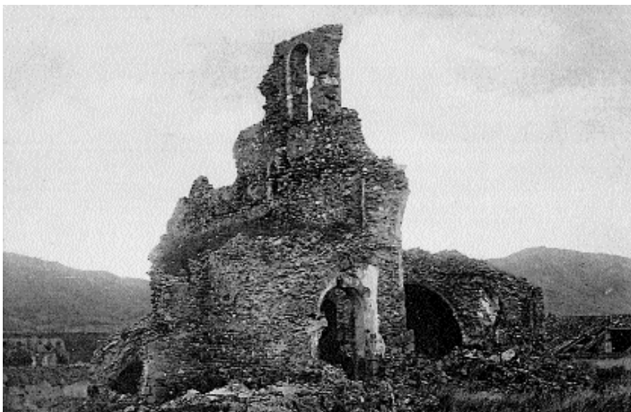
Roses. Ruïnes de l'església de la Ciutadella.