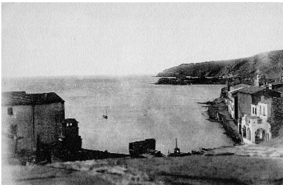
Cadaqués. El Port, costa de ponent.

abundància de fonts és un reflex dels seus escrúpols com a científic, i del seu mètode comparatiu, tot i que confecciona un mapa alterat. D'altra banda tot llegint la col·lecció d'atles i plànols de ciutats de Girona (XVII-XX), (9) ens adonem de la importància estratègica que fins la guerra del Francès van tenir les viles i ports fortificats de Roses, el Port de la Seva, Cadaqués, etc. La cartografia d'aquestes poblacions, d'aquests recintes, obres importants d'enginyeria, permeten moltes lectures. La majoria són mapes traçats per militars espanyols i francesos, erudits locals (Escoffet, nadiu de Cadaqués), que posseïen bons coneixements de dibuix sobre els quals Jaubert en dóna, a les pàgines inicials, una primera relació. Amb la invasió en 1823 dels Cent Mil Fills de Sant Lluís, que van envair Espanya per restaurar la monarquia absoluta de Ferran VII, s'alcen molts planells i s'escriuen informes que ajudaran el mariscal Monecy a penetrar al país amb el quart cos de l'Exèrcit dels Pirineus.