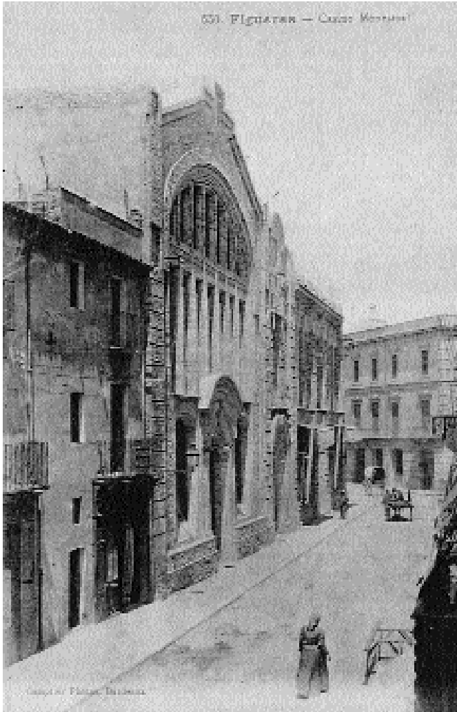
Imatge de la façana de l'edifici del Casino abans de la remodelació de l'any 1925 de l'arquitecte Boris i Gensana.

La decoració, la compra de mobles, les obres d'infraestructura, de reforma i d'ampliació, etc., segons les possibilitats i en concordança amb les necessitats que es van presentant són una segona cursa d'obstacles que pot durar anys. De fet, un balanç ràpid de la lectura de les actes del Casino Menestral dona una sensació d'haver d'arranjar l'edifici molt sovint.