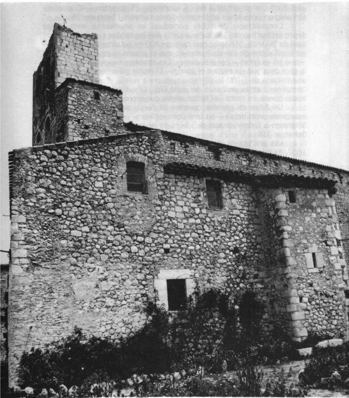
Capella i sagristia afegides al temple parroquial el s. XVIII