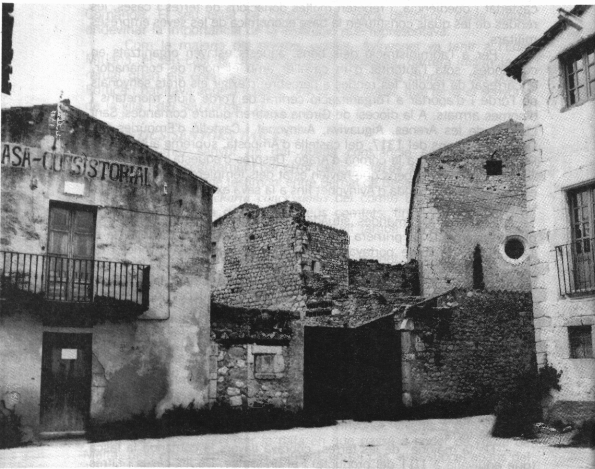
Restes de la comanda dels templers amb la capella, avui casa de la Vila.