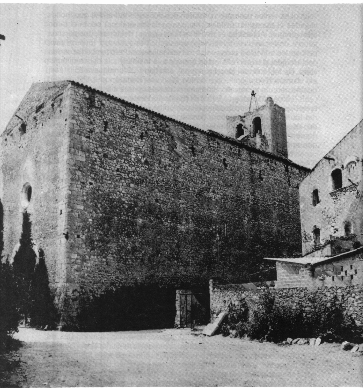
Façana actual de l'església parroquial.