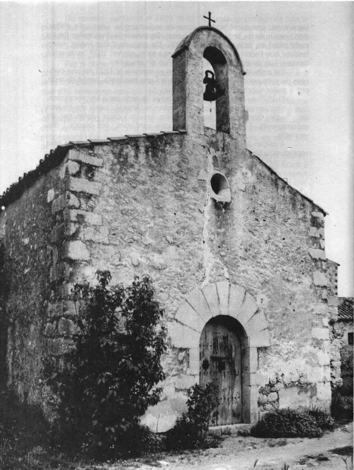
Capella de Santa Eugènia.