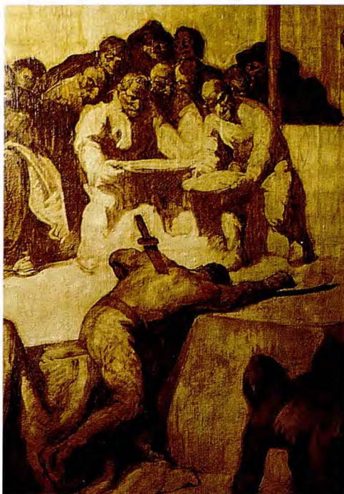
SERT. MURAL À L'HÔTEL DE VILLE DE BARCELONE (DÉTAIL).

– le 9 décembre 1988, face à l'augmentation du Sida en Catalogne, tous les groupes politiques représentés au