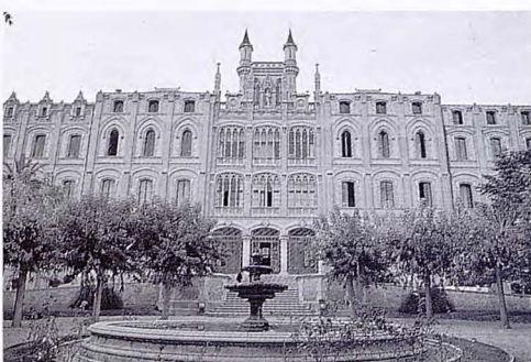
ÉCOLE SAINT IGNASI DE SARRIÀ

LE CAMP INTERNATIONAL DES JEUNES (CIJ) DE BARCELONA'92 SE PROPOSE D'OFFRIR À DES JEUNES DU MONDE ENTIER UN ESPACE D'ÉCHANGE CULTUREL ET SPORTIF DANS LE BUT D'ENCOURAGER LA CONNAISSANCE DES CULTURES ET D'IMPULSER LE SENTIMENT DE RESPECT ET D'APPARTENANCE À LA COMMUNAUTÉ MONDIALE.