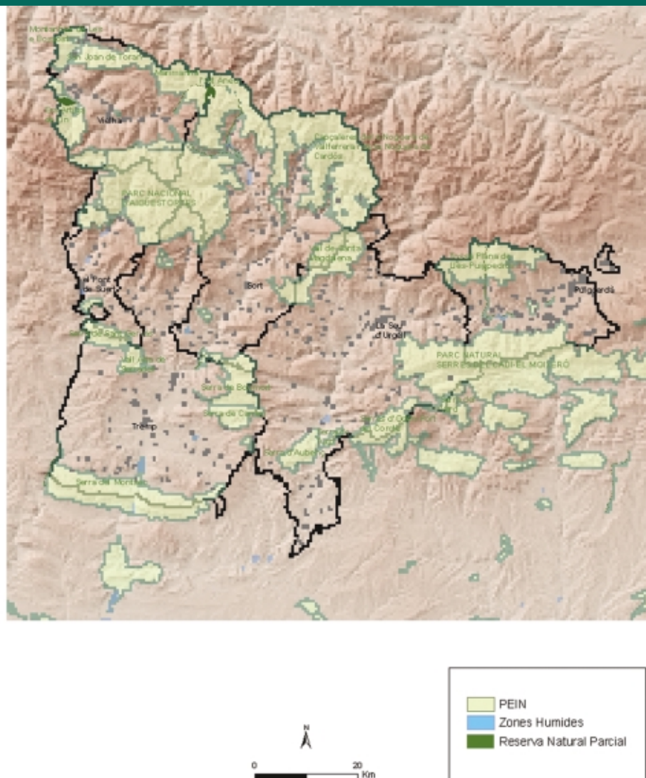
Figura 2 Espais d'interès natural