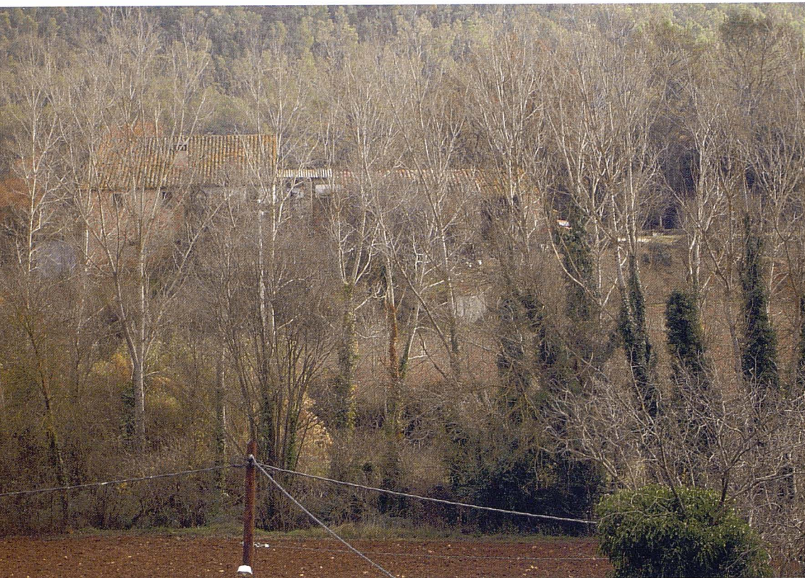
Paisatge d'hivern del Baix Empordà. F. Vilero