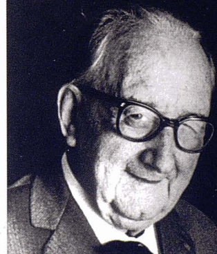
Fotografia del geògraf Pau Vila.

“ CONVÉ RECORDAR-HO: TOT PAISATGE ESTÀ INDISSOLUBLEMENT UNIT A UNA CULTURA I AQUESTA CULTURA OCUPA UNA PORCIÓ DETERMINADA DE LA SUPERFÍCIE TERRESTRE QUE ANOMENEM, GENÈRICAMENT, REGIÓ