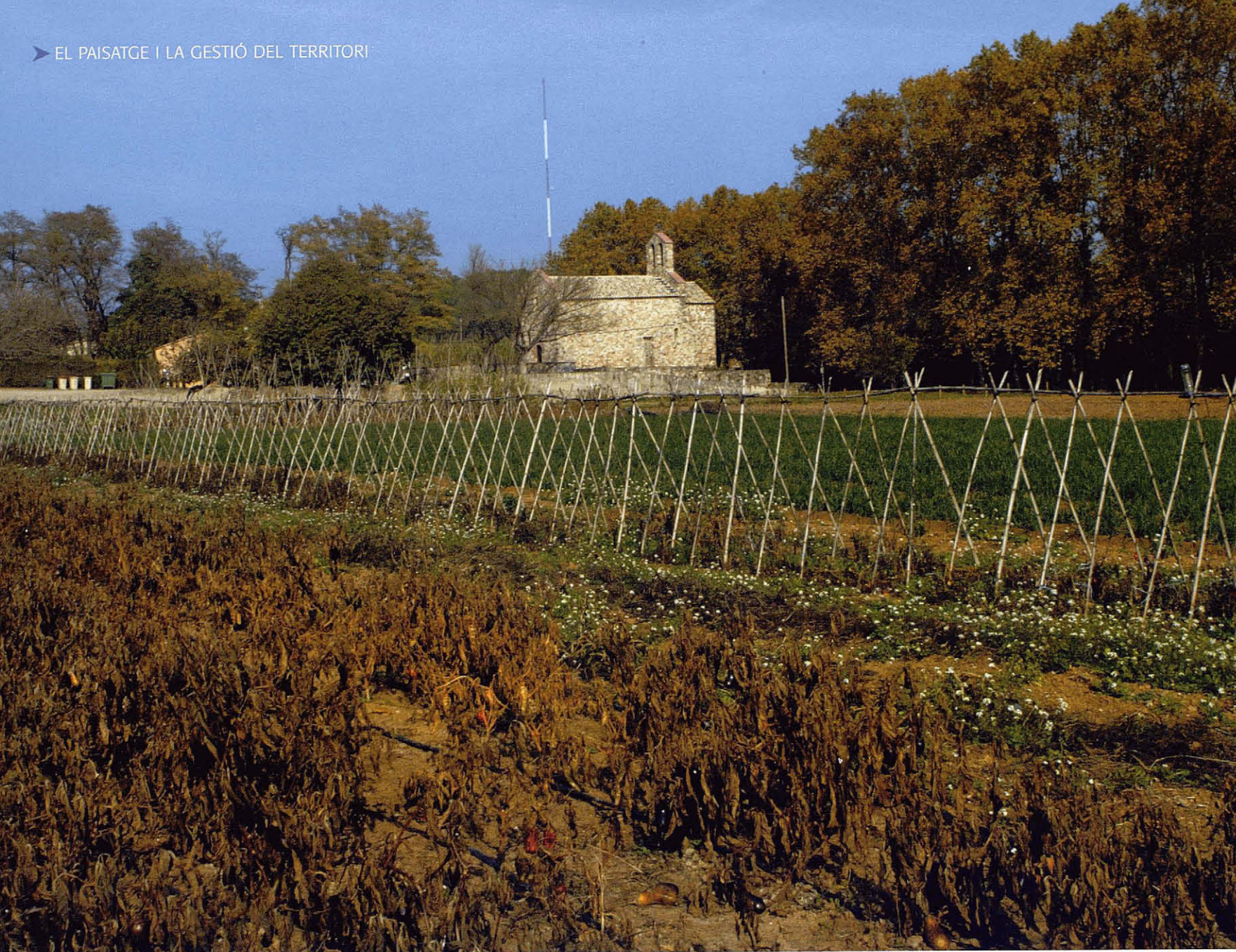
Ermita de Santa Maria de Gallecs. Amb la recent aprovació del Pla director urbanístic de Gallecs es conservarà aquest espai verd del cor del Vallès. R. Vilalta