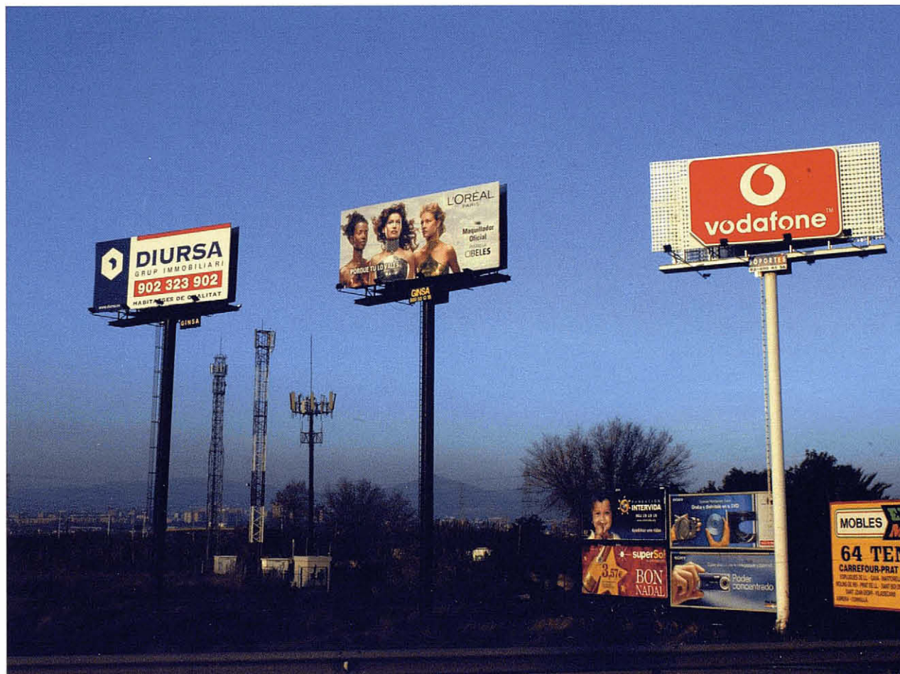
Paisatge degradat amb finalitats comercials, a l'autovia de Castelldefels. R. Vilalta

El paisatge és el resultat d'una transformació col·lectiva de la natura; és la projecció cultural d'una societat en un espai determinat. I no només en allò referent a la seva dimensió material, sinó també a la seva dimensió espiritual i simbòlica. Les societats humanes, a través de la seva cultura, transformen els originaris paisatges naturals en paisatges culturals, caracteritzats no només per una determinada materialitat (formes de construcció, tipus de conreus), sinó també per la translació al propi paisatge dels seus valors, dels seus sentiments. El paisatge és, per tant, un concepte enormement impregnat de connotacions culturals i es pot interpretar com un