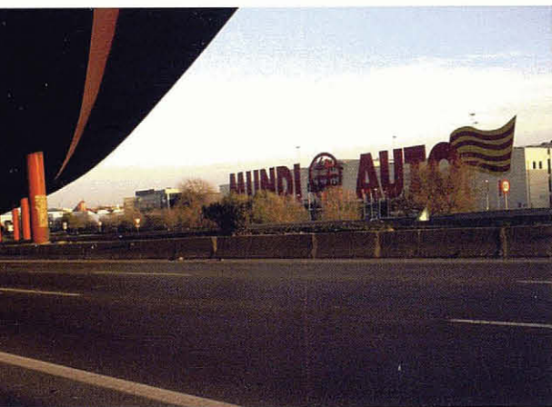
El Prat de Llobregat des de l'autovia de Castelldefels. R. Vilalta