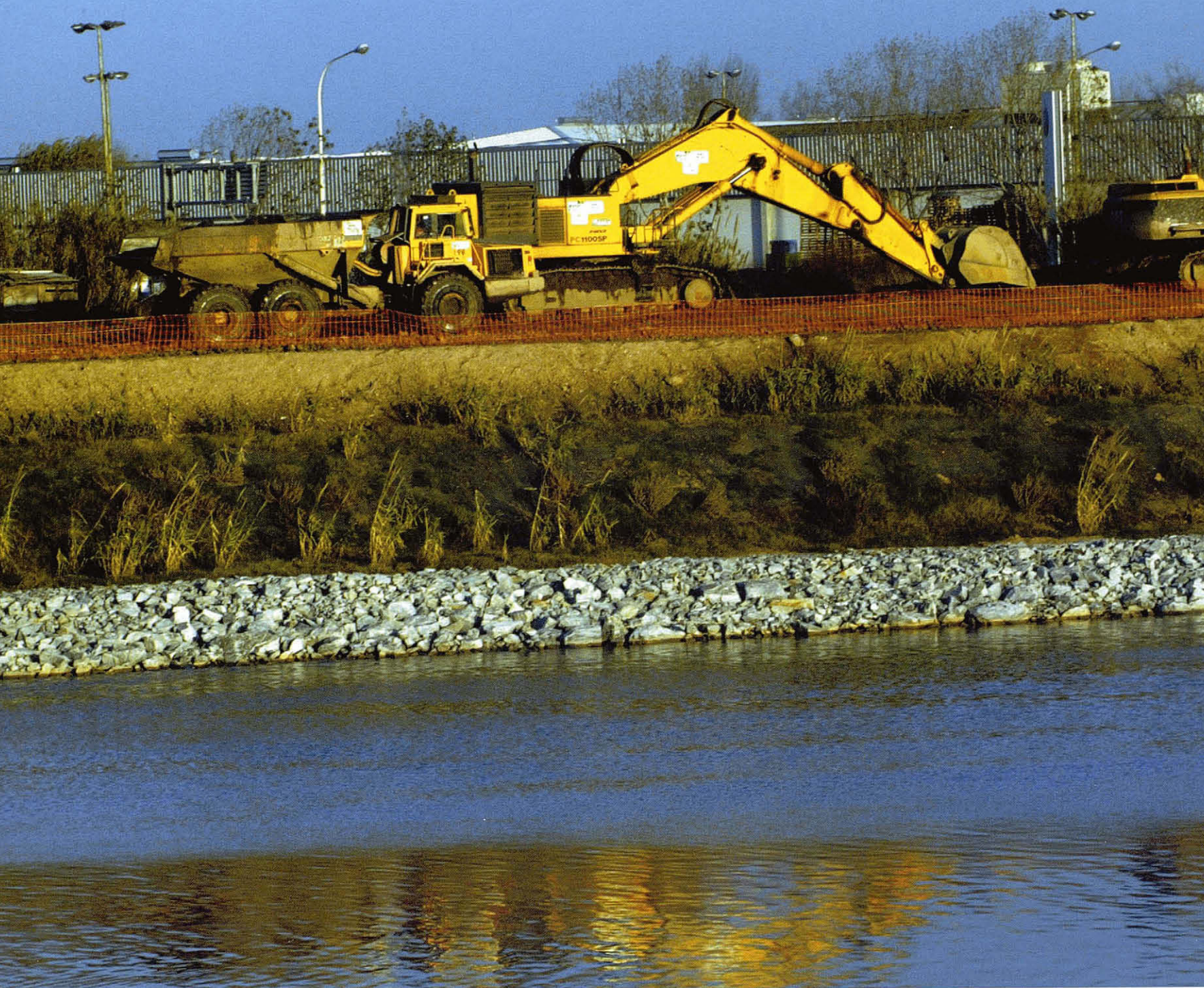
Tasques de desviament de la desembocadura del riu Llobregat. R. Vilalta

codi de símbols dinàmic que ens parla de la cultura del seu passat, de la del seu present i potser també de la del seu futur. La llegibilitat semiòtica del paisatge, aquest és el grau de descodificació dels seus símbols, pot ser més o menys complexa, però està lligada, en qualsevol cas, a la cultura que els produeix.