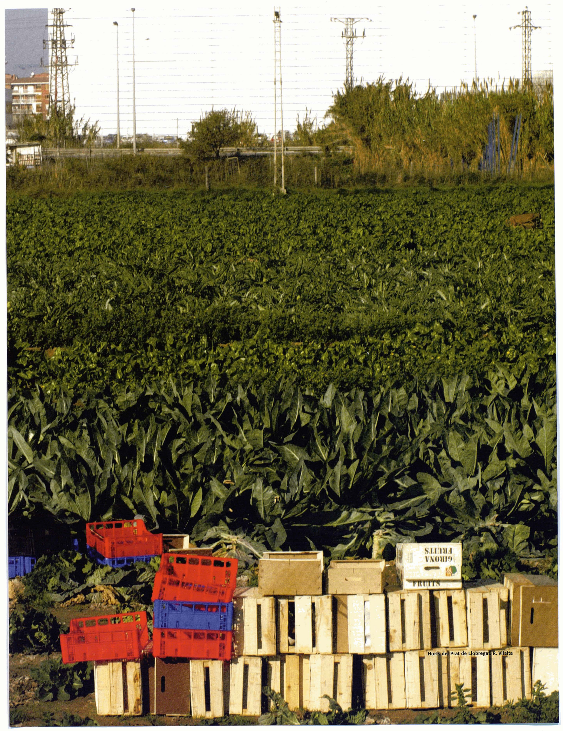
Horts del Prat de Llobregat. R. Vilalta