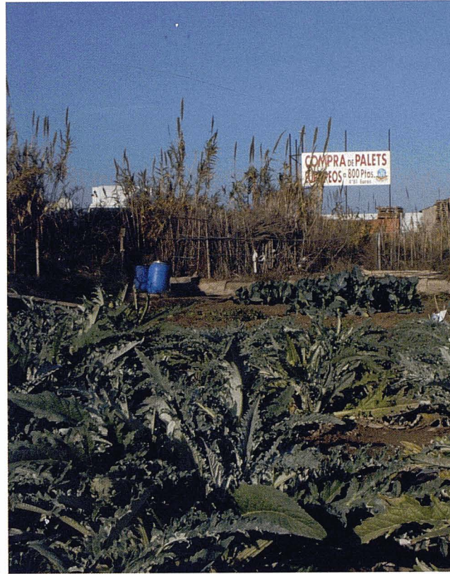
Horts al Prat de Llobregat.