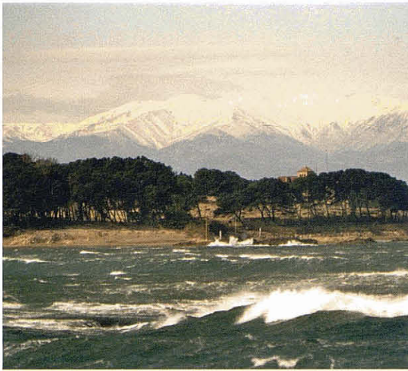
Empúries i el Canigó (Alt Empordà). La preservació i gestió dels valors del paisatge pot ser un actiu per al desenvolupament. A. Tarroja

del paisatge a la legislació positiva. Així, l'aplicació d'aquesta s'es-tenia al conjunt del territori (tant si era natural, com agrícola, urbà o periurbà); proporcionava un marc de referència per a les legis-lacions sectorials que afecten el paisatge; establia la incorporació de plans directors del paisatge al planejament territorial general que havien d'establir objectius de qualitat orientats a preveure'n la transformació atenent a paràmetres de qualitat patrimonial i ambiental; proposava instruments de gestió i de participació, i establia el finançament de les intervencions a través d'un fons per a la conser-vació i millora del paisatge finançat per una taxa de l'1% sobre les implantacions d'interès públic en sòl no urbanitzable.