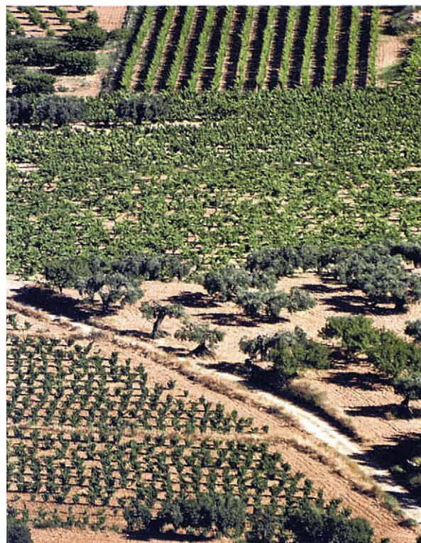
Detall del mosaic agrícola de la Terra Alta, vist des del Coll del Moro. La producció i transformació d'alt valor afegit pot preservar paisatges històrics de qualitat. A. Tarroja

En definitiva, per la seva proximitat a les persones en tant que espai viscut i per la proximitat del concepte, el paisatge pot esdevenir un element clau per a sensibilitzar àmplies capes de la població sobre