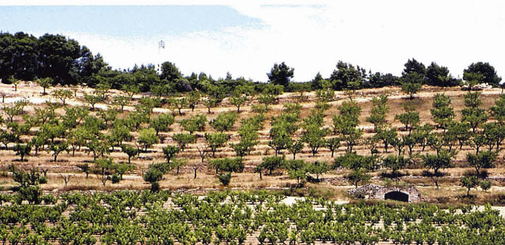
Vilalba dels Arcs (Terra Alta). Un paisatge agrari tradicional que actualment es debat entre la memòria històrica de la Batalla de l'Ebre i els parcs eòlics. A. Tarroja