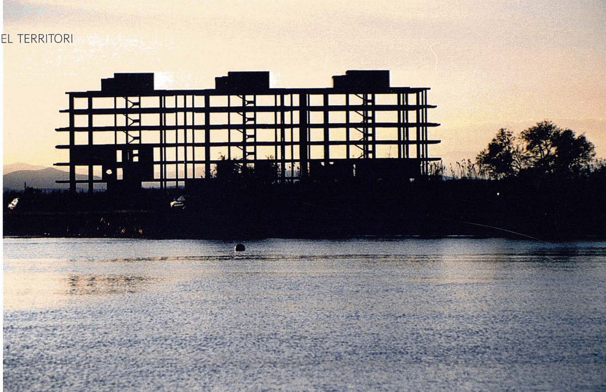
Urbanització recentment enderrocada Fluvianàutic a Sant Pere Pescador (Alt Empordà). La urbanització indiscriminada del litoral ha generat mobilitzacions ciutadanes. A. Tarroja