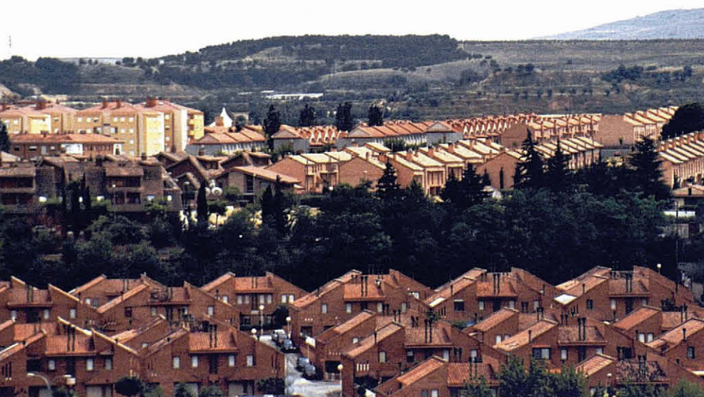
Estandardització, repetició i banalització dels paisatges en aquest exemple de Tarassona (Saragossa).

Una altra iniciativa particularment destacada és la Proposició de llei per a la protecció, conservació i gestió del paisatge presentada al Parlament de Catalunya l'any 2002. La Proposició de llei exposava la possibilitat de transferir els principis de la Convenció europea