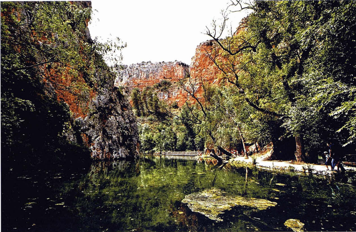
Jardins del Monasterio de Piedra (Saragossa). El jardí romàntic i l'àmplia valoració cultural que tenim els ciutadans d'aquesta estètica del paisatge té una forta base cultural. A. Tarroja

“ ASSUMINT QUE EL PAISATGE ÉS VIU I QUE RESPON A AQUESTA RELACIÓ CANVIANT ENTRE LA SOCIETAT I EL SEU TERRITORI, LLAVORS EL REPTÉ ÉS APRENDRE A GESTIONAR-NE LES TRANSFORMACIONS