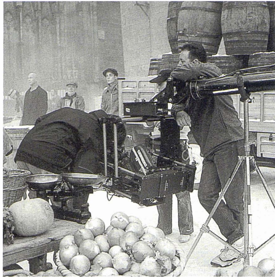
Rodatge d'un anunci a la Catedral de Barcelona. Piramide