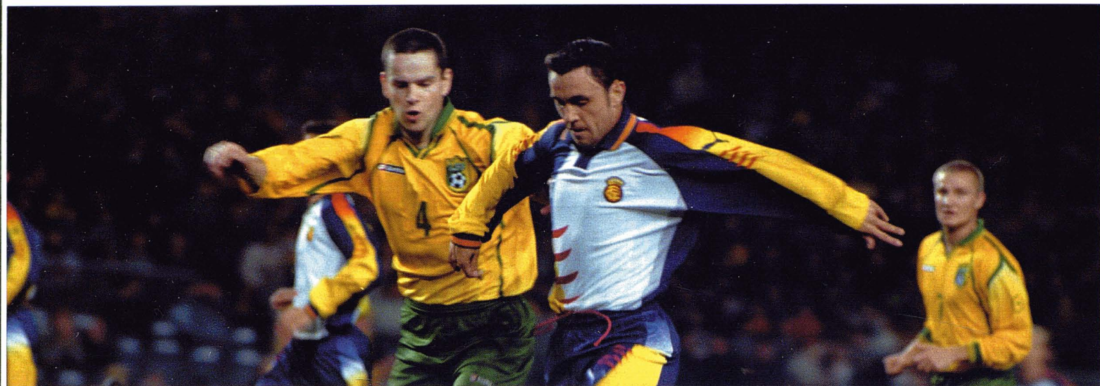
Partit de la selecció catalana de futbol. R. Moreno