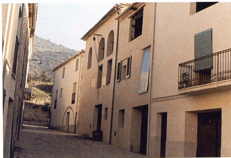
Façanes del carrer Major.