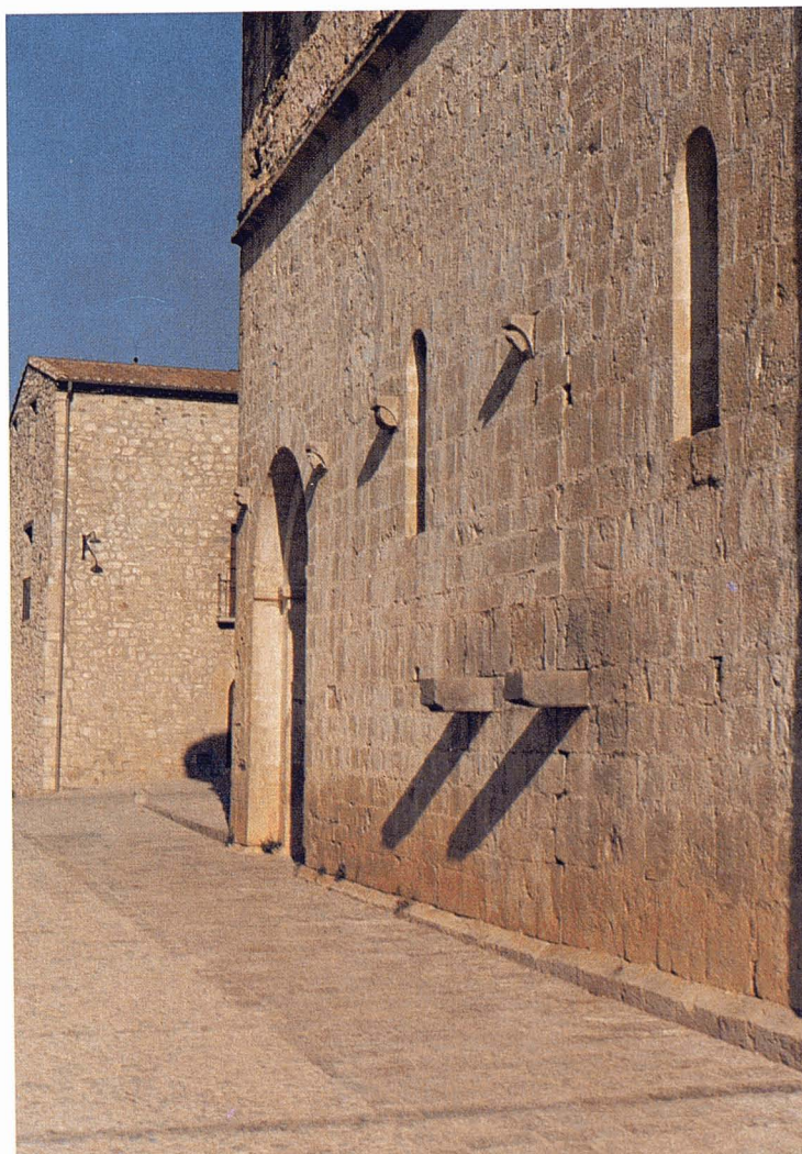
Pavimentació de la plaça de l'església.