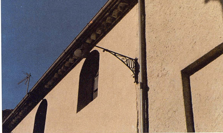
Detall del ràfec i l'enllumenat.

Un dels aspectes més evidents del procés de transformació de l'Alta Garrotxa durant el present se-