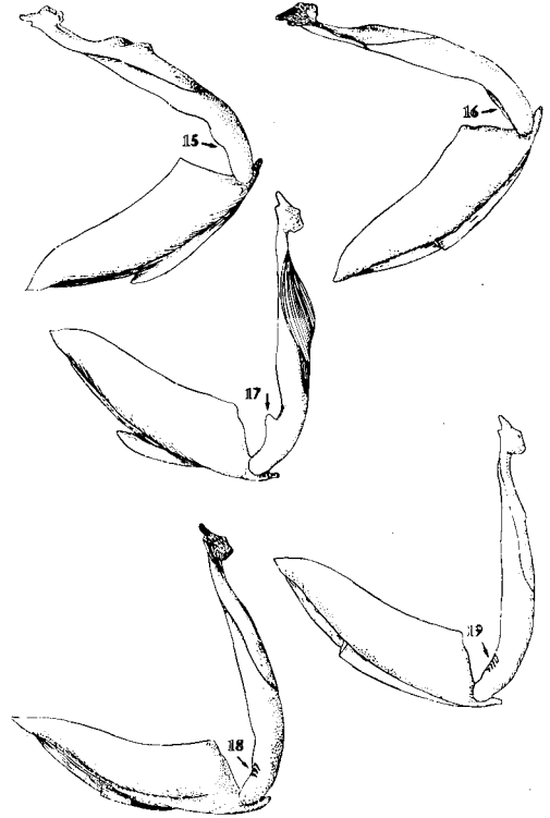
Figs. 15-19. Vista lateral del aparato genital femenino; 15. D. circumflexus F.; 16. D. marginalis L.; 17. D. semisulcatus Müll.; 18. D. pisanus C.; 19. D. dimidiatus Bergstraer.

10. Genital valves of Dytiscus marginalis L.; 11. Lateral view of the penis of D. pisanus Castelnau; 12. Paramere of D. pisanus C.; 13. Tegmen of D. pisanus C.; 14. Genital valves of D. pisanus C.